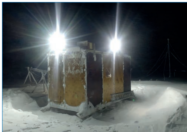
Метеокомплекс в ледовом лагере в метель. 14 декабря 2023 года.