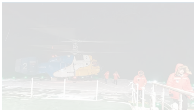
На НЭС «Северный полюс» встретили вертолет с необходимыми грузами. 11 января 2024 года