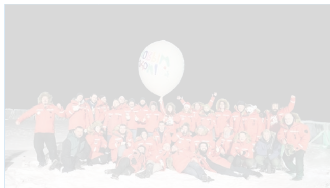
Участники СП-41 встречают новый 2024 год. 1 января 2024 года

В рамках частичной ротации на станцию были доставлены три новых члена экспедиции (руководитель гидрохимической группы, геолог и егеря), вывезены чет-