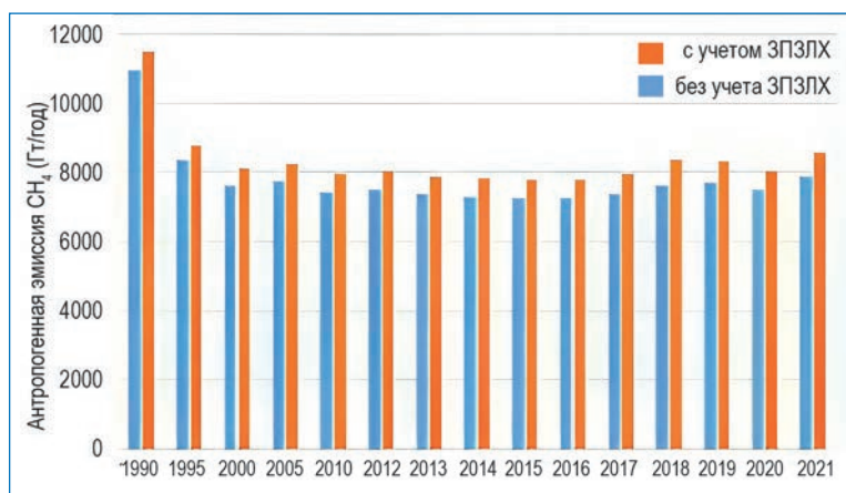
Рис. 1. Эмиссия из антропогенных источников с территории Российской Федерации в период 1990–2021 годов с учетом и без учета землепользования, изменений в землепользовании и лесного хозяйства (ЗИЗЛХ) по данным Национального кадастра антропогенных выбросов

В Докладе об особенностях климата на территории Российской Федерации за 2022 год отмечается: «Тенденция повышенного роста \text{CH}_4 начала проявляться с 2019 г., в котором на станции Тикси регистрировались высокие значения концентрации в период максимума природной эмиссии (август-сентябрь). В 2020 г. значения \text{CH}_4 на этой станции оставались высокими до конца года и эта тенденция начала прослеживаться на станции Териберка. В 2022 г. зафиксировано сильное увеличение концентрации метана на станции Териберка (20 млрд -1 /год) и снижение прироста на станции Тикси, при этом уровень концентрации \text{CH}_4 на этих двух станциях сравнялся». Не лишне отметить интенсивный прирост эмиссии метана в арктическом регионе: долго-