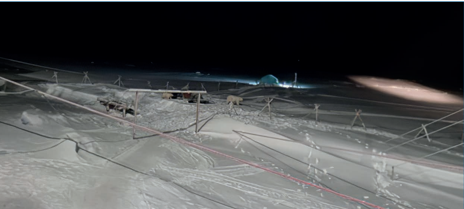
Белые медведи в ледовом лагере у НЭС гуляют вдоль кабель-трассы. 24 октября 2023 года