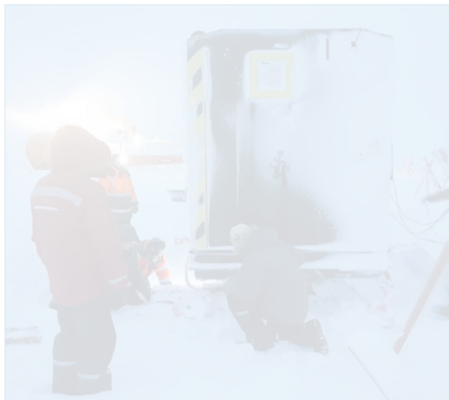
Работы по укреплению геофизического павильона в ледовом лагере. 22 октября 2023 года

– Прием информации от автономных буев, размещенных на полигоне в районе дрейфа станции.