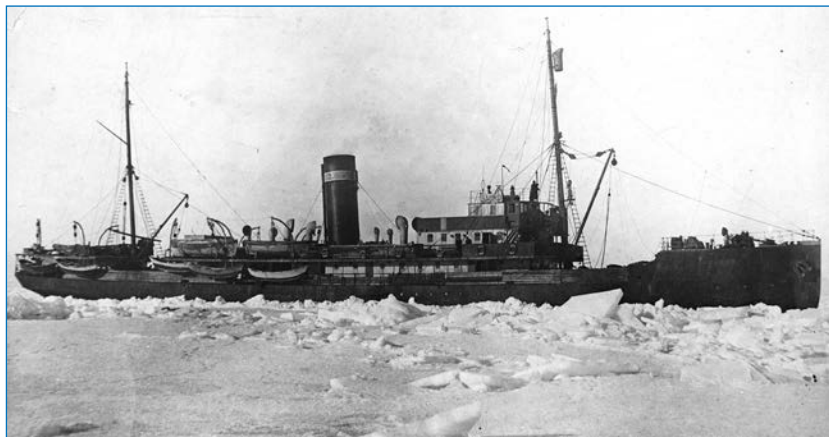
Ледокольный пароход «Садко», 1930-е годы.