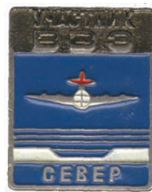
Значок «Участник ВВЭ «Север»». 1979 год