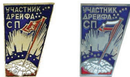
Памятные значки «Участник дрейфа СП». Справа значок начала 2000-х годов