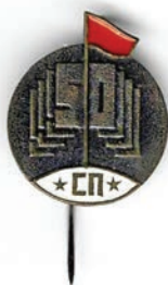
Значок «50 лет СП». 1987 год