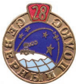
Сувенирный значок «Северный полюс-28». 1987 год