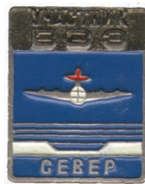
Значок «Участник ВВЭ «Север»». 1979 год