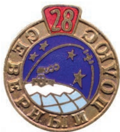
Сувенирный значок «Северный полюс-28». 1987 год