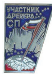
Памятные значки «Участник дрейфа СП». Справа значок начала 2000-х годов