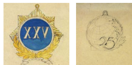
Эскизы значка «25 лет АНИИ». Художник А. Козлов (а), автор не указан (б). 1945 год. ЦГАНТД СПб