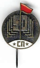
Значок «50 лет СП». 1987 год