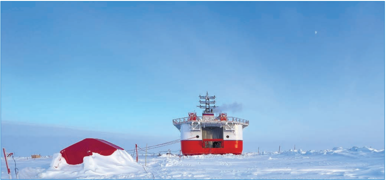
Выносной ледоисследовательский пункт вблизи от ЛСП. 30 марта 2023 года

– в апреле выполнена станция исследования физических свойств льда у борта судна и трехмерное моделирование корпуса судна;