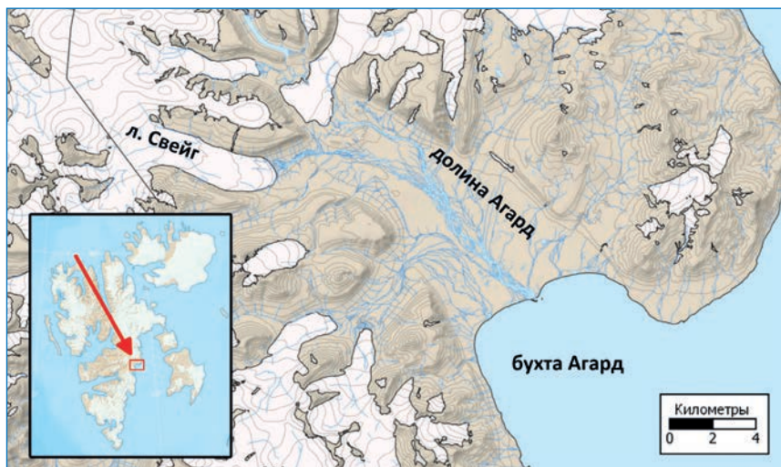
Район производства работ на восточной части острова Западный Шпицберген