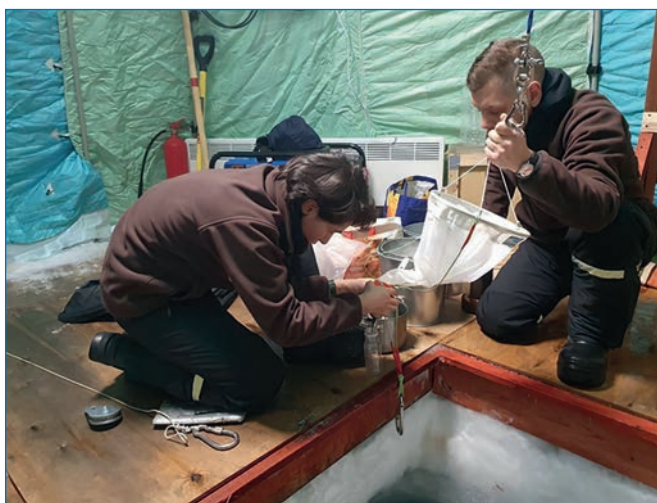
Отбор ледовых (внизу) и планктонных (вверху) проб.

Научная программа экспедиции рассчитана на 2-летний цикл исследований природной среды, закономерностей и причин изменений климатической системы центральных районов Северного Ледовитого океана (СЛО). Криобиологический блок программы гидробиологических исследований направлен на изучение пространственно-временных и физико-химических характеристик водно-ледовой среды и видового состава ледовых и планктонных сообществ (Мельников И.А. Исследования по теме «Криаль» в экспедиции «Северный полюс-41» // Океанологические исследования. 2022. № 50 (4). С. 210–214. https://doi.org/10.29006/1564-2291.JOR-2022.50(4).9 ).