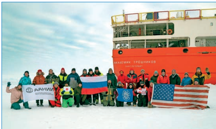
Участники экспедиции NABOS-2021 на НЭС «Академик Трёшников».