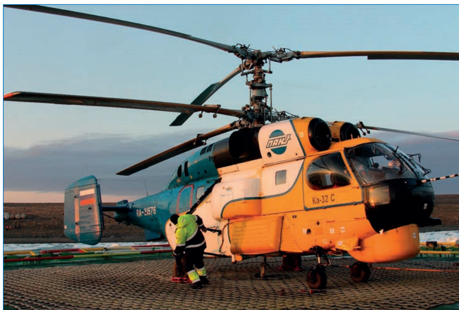
Вертолет Ка-32 С на вертолетной площадке НЭС «Академик Трёшников».

– отобраны образцы растений, мхов, лишайников и бактерий для определения их видов и оценки биоразнообразия.