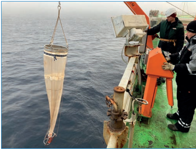
Отбор зоопланктона при помощи сетки WP2.