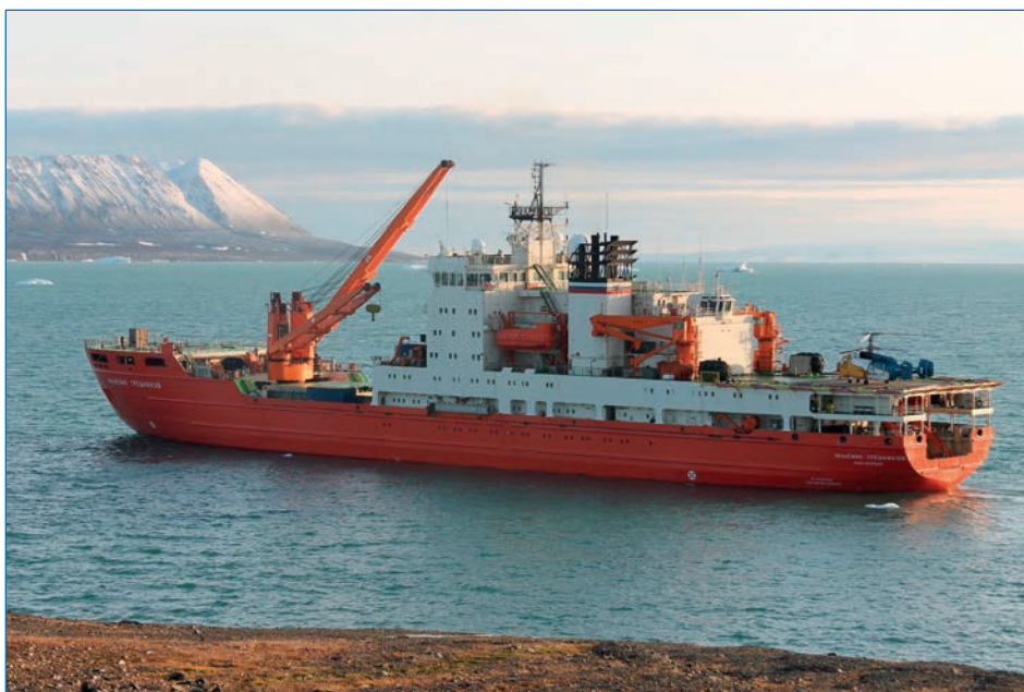
НЭС «Академик Трёшников» у научно-исследовательского стационара «Ледовая база Мыс Баранова».

Благодаря кооперации с германскими учеными, в ходе экспедиции было выполнено 159 станций вертикального зондирования толщи воды с использованием зонда SBE 911 (86 станций) и зонда Underway CTD (73 станции), позволяющего проводить измерения во время движения судна.