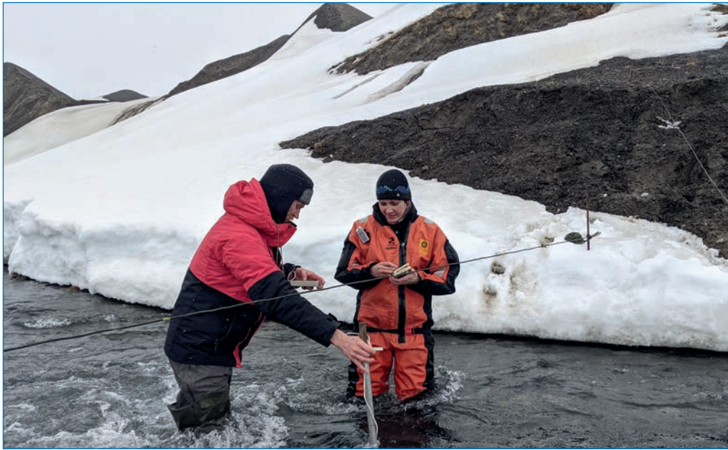
Измерение стока воды на реке Бретьерна, июнь 2021 г.

К 2021 году РАЭ-Ш полностью адаптировалась к новым условиям и выстраивала свои экспедиционные планы, гибко реагируя на изменения антиковидных мер в Российской Федерации, Норвегии и на региональном уровне — на Шпицбергене. Постоянно отслеживались правила Норвегии и других европейских стран, через которые возможен транзит, прорабатывались различные, включая весьма экзотические, варианты проезда сотрудников. Один из маршрутов шел через Стамбул (!), несколько человек успешно им воспользовались, но последней группе не повезло — их отказались посадить на рейс Стамбул — Осло.