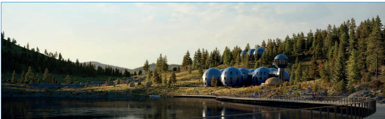
Проект станции «Снежинка»

«Зеленый» подход отличает также и систему обращения с отходами. Органические отходы будут перерабатываться в компост и использоваться в качестве удобрений при посадке деревьев вокруг «Снежинки».