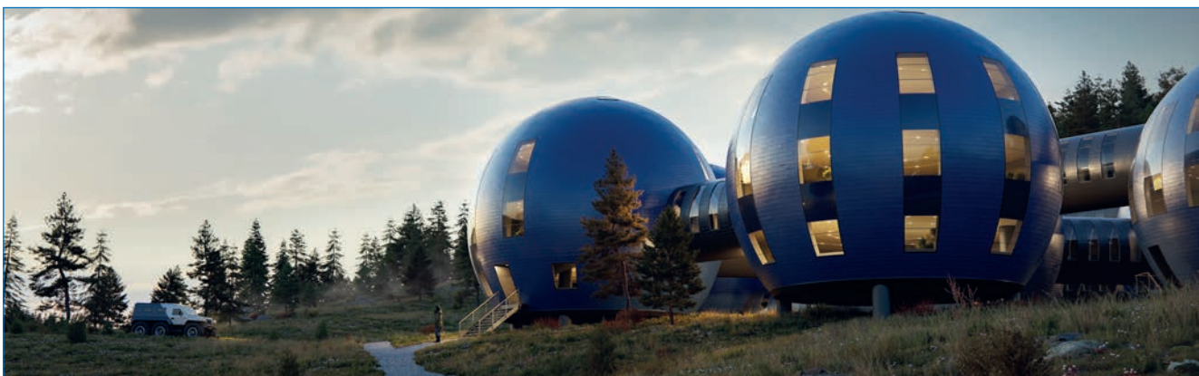
Проект модулей станции «Снежинка»