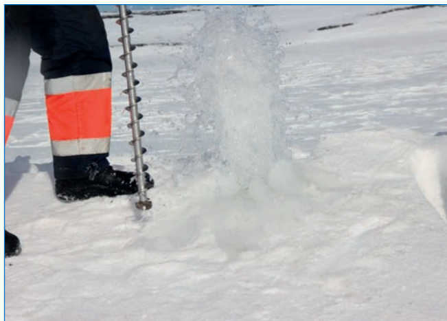
Фонтан газирующего рассола на арх. Северная Земля.