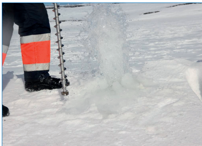
Фонтан газирующего рассола на арх. Северная Земля.