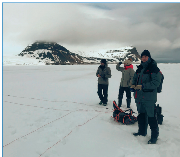
Выполнение электроразведочных работ с припая в районе острова Белл (арх. Земля Франца-Иосифа).

меси крупнообломочного материала. В сентябре 2021 года здесь планируется разбить площадку мониторинга сезонно-талого слоя. Расположение данной площадки в непосредственной близости от действующей обсерватории позволит ежегодно проводить регулярный съем данных с полигона и контроль средств измерений. В качестве дополнительного варианта расположения мониторингового полигона была предложена морская терраса на соседнем острове Алджер, куда группа ученых была также доставлена на вертолете. Здесь сложенная песками терраса разбита