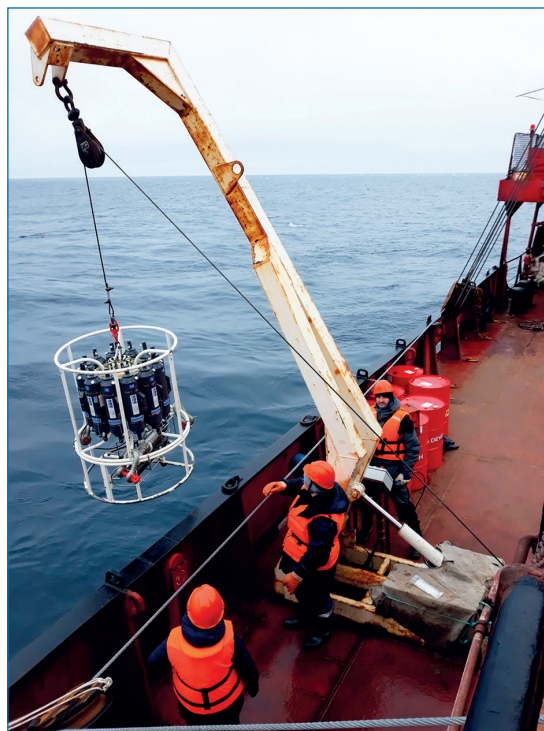
Работа с пробоотборным комплексом SBE 32.

ры показала, что средний уровень в ходе экспедиции не превышал обычных для этого района значений и составил около 370 ppb, при минимальных значениях и максимальных значениях 355 и 380 ppb соответственно.