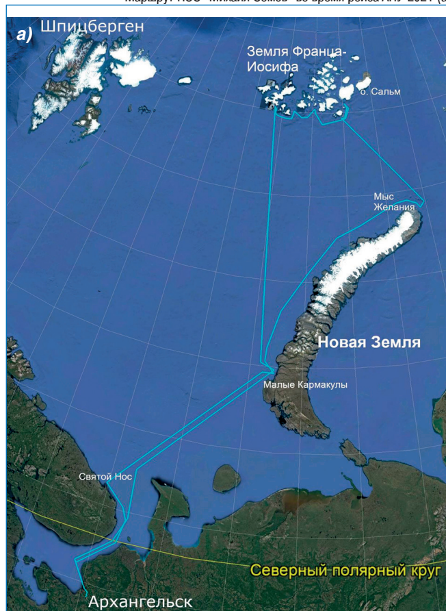
Маршрут НЭС «Михаил Сомов» во время рейса АПУ-2021 (а) и расположение стандартного океанографического разреза (б)

метеорологии, изучению многолетнемерзлых грунтов и климатологии. В рамках научно-исследовательского направления были выполнены океанографические и гидрооптические измерения на стандартном океанографическом разрезе от мыса Желания (Новая Земля) до острова Сальм (арх. Земля Франца-Иосифа). Также по всему маршруту экспедиции проводились непрерывные измерения основных метеорологических величин (температура, относительная влажность воздуха, атмосферное