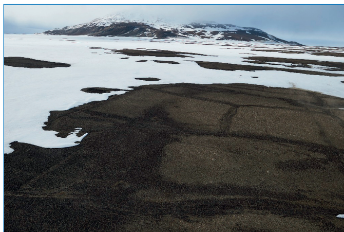
Сетка полигонально-жильных льдов на сложенной песками второй морской террасе о. Алджер.

Одним из наиболее подходящих мест оказался район российской гидрометеорологической обсерватории им. Э.Т. Кренкеля на острове Хейса (Земля Франца-Иосифа). Здесь в 1 км от станции на второй морской террасе выявлена ненарушенная ровная горизонтальная площадка, сложенная однородными песками без при-