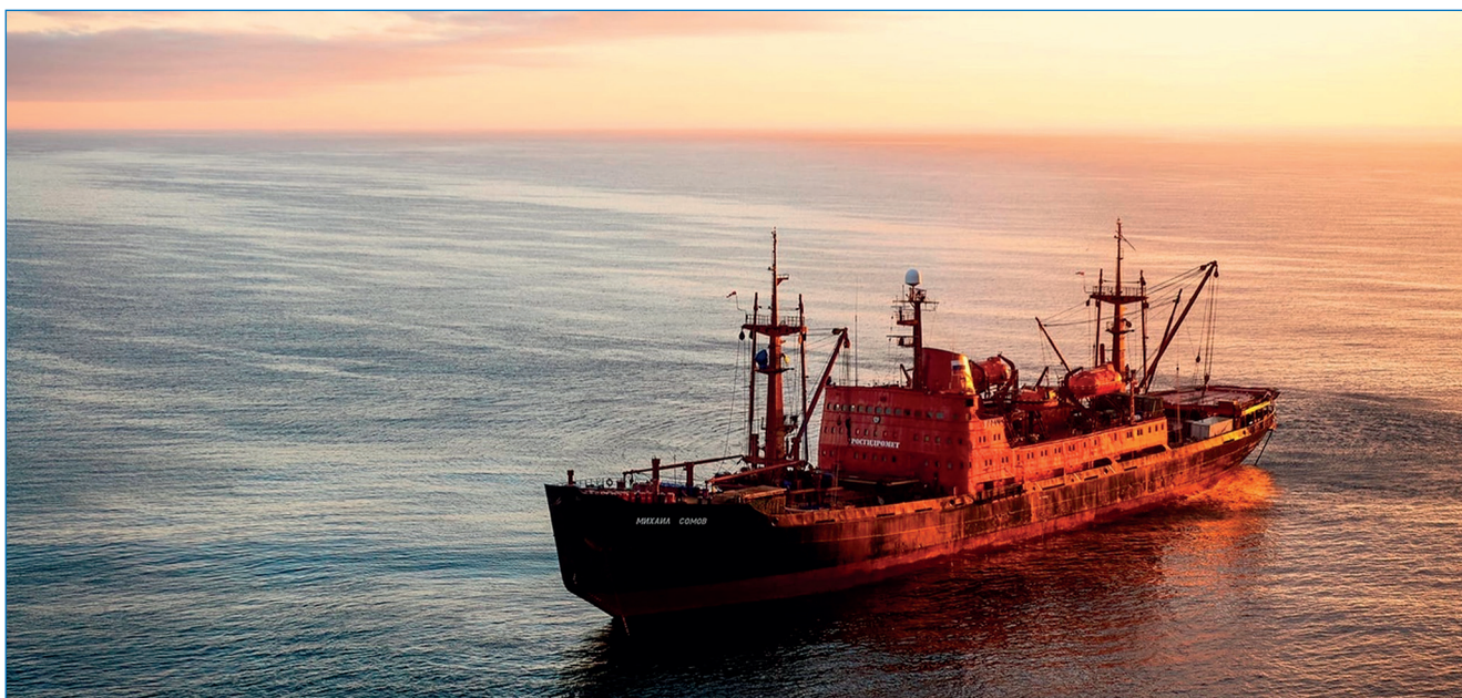
НЭС «Михаил Сомов» в Баренцевом море. 2021 год.

Экспедиция прошла в период с 10 июня по 1 июля 2021 года по маршруту Архангельск — Баренцево море — арх. Новая Земля — арх. Земля Франца-Иосифа — арх. Новая Земля — Баренцево море — Архангельск (см. рисунок).