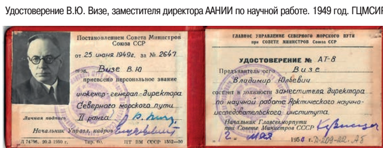
Удостоверение В.Ю. Визе, заместителя директора АНИИ по научной работе. 1949 год.