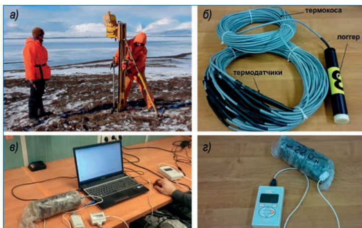
Рис. 3. Примеры оборудования для использования в ходе создания пунктов мониторинга ММГ (а – буровая установка УКБ-12/25; б – термокосы «МГУ-геофизика»; в – прибор KD2-PRO для определения теплопроводности грунтов; г – термометр цифровой для определения температуры кернов и температуры начала замерзания)

Требуемые для реализации проекта материальные, финансовые и людские ресурсы сравнительно невелики. С решением задач проекта способна справиться группа из 8–10 специалистов, логичным представляется ее формирование