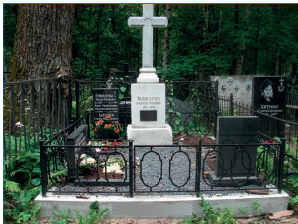
Могила М.М. Ермолаева на Серафимовском кладбище

Г.П. Аветисов (ВНИИОкеангеология). Фото из архива автора