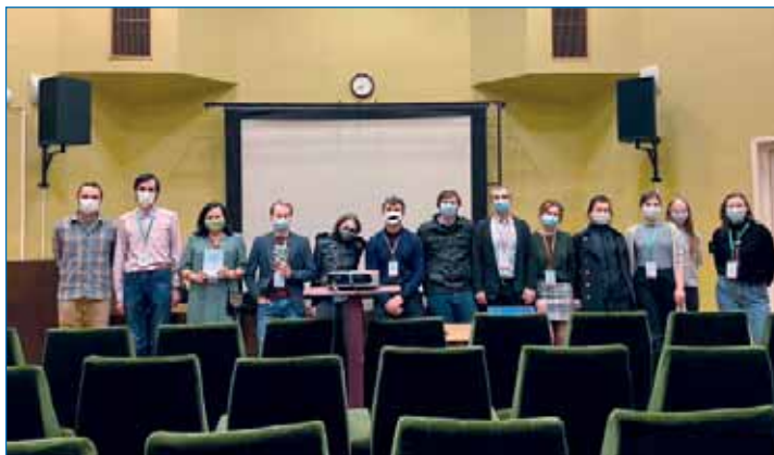
Группа участников конференции

вигационной системы и спутниковой системы позиционирования. Калибровка комплекса производилась в аэродинамической трубе. Для измерения турбулентных пульсаций температуры воздуха используется термометр сопротивления в виде открытой платиновой нити, специально разработанный в Центральной аэрологической обсерватории.