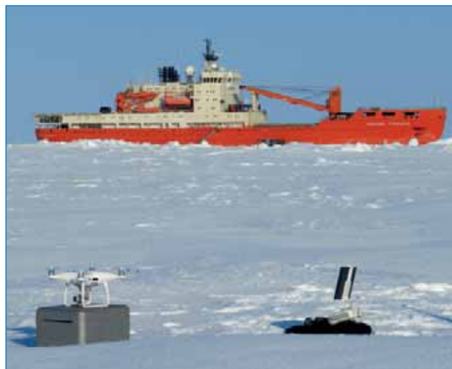
Квадрокоптер "DJ Phantom Pro 4" использовался в экспедиции "Трансарктика -2019"

Доклад специалистов ААНИИ затронул ту «нишу», которую не смогли покрыть своими измерениями коллеги из Москвы и Томска. Это касается измерений альбедо (точнее, отраженной солнечной радиации) различных типов снежно-ледяной поверхности. В первую очередь, это касается таких объектов, где проведение стандартных наземных измерений невозможно (краевая зона ледников — зона трещин, торосы, эпিশельфовые озера и т. п.). Была использована непрофессиональная модель квадрокоптера DJI Phantom Pro4, имеющая возможность (по грузоподъемности) поднять на своем борту разработанный в ААНИИ оригинальный измерительный комплекс (автор — науч. сотр. ОЛРиП С.С. Сероветников). Комплекс, основанный на использовании известных процессорных микросхем, имел в своем составе малоинерционный фотометр LQ-190SA (фирма LICER, США), работающий в диапазоне 400–700 нм (фотосинтетическая активная радиация) и портативный ИК-термометр (радиометр), работающий в диапазоне 8–14 мкм (так называемое «окно прозрачности атмосферы»). Это обстоятельство позволило специалистам ААНИИ избежать значительных затрат, связанных с приобретением дорогостоящих высокопрофессиональных средств измерений и регистрации данных, которыми располагали наши коллеги из Москвы и Томска. Финансовая поддержка исследований была обеспечена грантом РФФИ № 18-05-00471 «Термодинамика торосов — новый взгляд на теплообмен между атмосферой и ледяным покровом в Арктике. Натурные эксперименты, моделирование», 65-й Российской антарктической