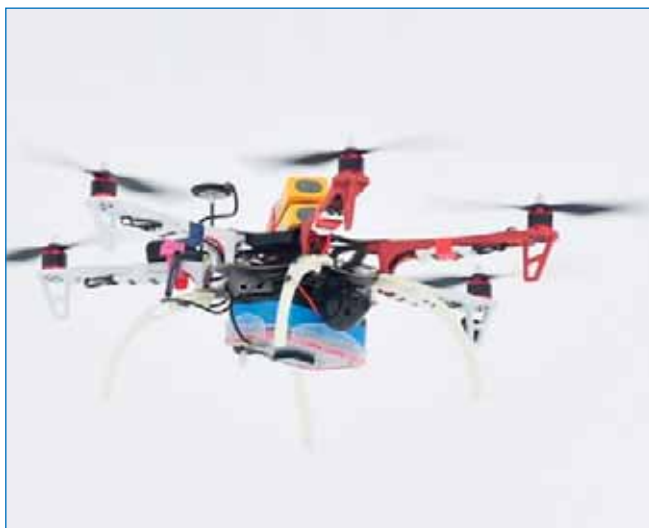
Квадрокоптер "Explorer Quad 2" в полете

рии. В результате продувки в аэродинамической трубе определен коэффициент восстановления температуры для данного датчика. Средние значения температуры и влажности воздуха измеряются с помощью калиброванного датчика Vaisala. Насколько известно, для измерения пульсаций влажности не существует малоинерционных датчиков, которые могли бы быть использованы на легких БПЛА. В качестве компромисса авторы использовали емкостной датчик влажности со временем отклика порядка 1 секунды. Для измерения температуры подстилающей поверхности используется инфракрасный датчик температуры. Основные объекты исследований — недоступные участки болот (Западная Сибирь), полыньи и разводья на крупных водоемах (Цимлянское водохранилище) и т. п.