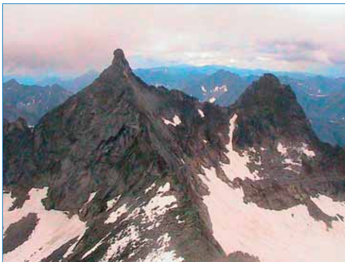
Рис. 3. Узловая вершина 2321 м северного отрога Верхнеангарского хребта. Внизу – перевал Ледниковый. Справа – кар ледника Огдында-Маскит

Температура льда бы-ла измерена на леднике Огдында-Маскит во время экспедиции в июле 2018 года, в самый жаркий месяц, в фирновом слое, в нижней