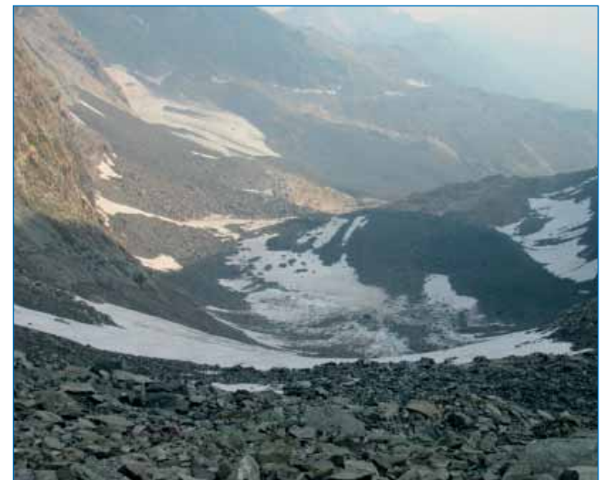
Рис. 8. Конечная морена ледника Разорванный-3 также не соответствует направлению движения современного ледника

Голоценовые ледники (такие, как Огдында-Маскит и Разорванный) повторно формировались в карах плейстоценового оледенения. Протяженные скальные стены, обрамляющие трого, служат экранами для снегонакопления. Ледники возникали как присклоновые и не всегда занимали весь кар. Их конечная морена тянется