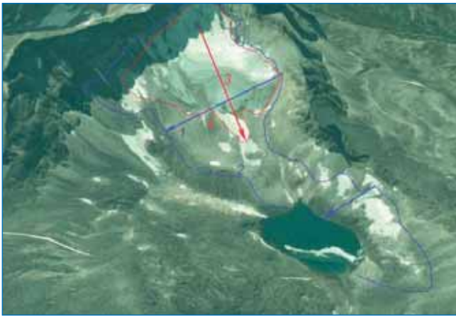
Рис. 5. Смена направления оси движения в результате деградации ледника: 1 – ось присклонового ледника; 2 – граница присклонового ледника; 3 – ось современного ледника (2019 г.); 4 – граница современного ледника

место эффект затененности. Что касается ледника Огдында-Маскит, то крутые и гладкие стены вмещающего кара, сложенные гранитами и пегматитами, закрывают ледник от солнечных лучей (на западную часть ледника солнце попадает только с востока, в этой части ледниковый язык круче обрывается и имеет меньшую высоту). Снег не успевает таять и испаряться, а соскальзывает с гладких склонов, пополняя фирновый бассейн, питающий ледник (рис. 3, 4).