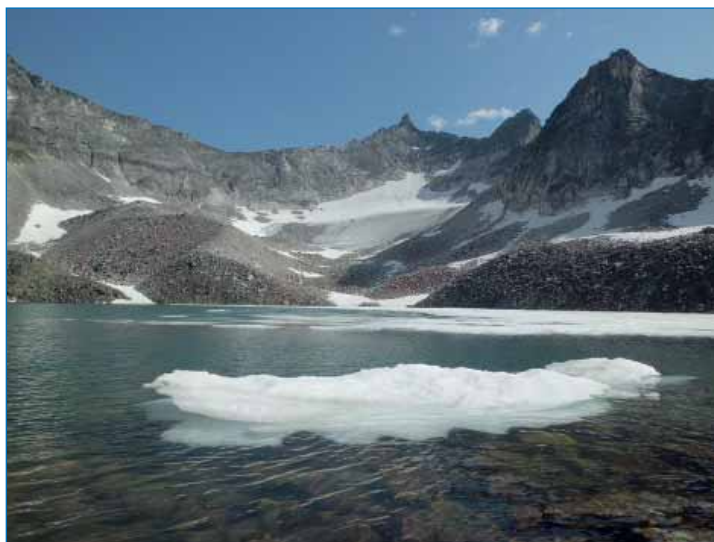
Рис. 2. Каровый ледник Огдында-Маскит

На Верхнеангарском хребте в большом количестве существуют и другие малые формы оледенения, в основном в виде очень плотных фирновых снежников с краевыми наледями и подстилающей ледяной основой. Некоторые из них являются многолетними. Обнаружены также ледниковые образования — ледник Горбатенький, Юрьева и уже почти стаявший ледник Кичера. Они занимают верхние кары висячих долин восточной экспозиции и в наибольшей степени сократили свои размеры — до 30 % пло-