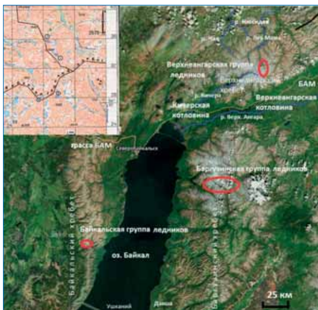
Рис. 1. Схема Байкальской ледниковой системы

В 30-х годах прошлого века во время 2-го Международного полярного года появились сведения о навейных ледниках на арктических островах и в субарктике (Земля Франца-Иосифа, Полярный Урал и др.). Малые формы были также названы эмбриональным оледенением (определение П.А. Шумского, 1955); это не связано с молодым возрастом), таковые распространены на Южном острове Новой Земли, в Приполярном и Полярном Урале, горах Чукотки. Этим термином можно обозначить совокупность свойств малых форм оледенения: небольшие размеры, наличие фирна, слабое разделение областей аккумуляции и абляции и пр.