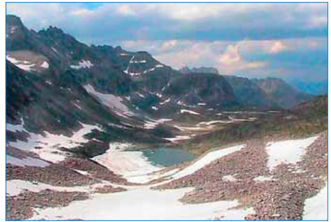
Рис. 6. Русловой лоток стока современного ледника Огдында-Маскит перегораживают 3 гряды поперечных стадияльных морен, отражающие осцилляции при отступании ледника

переноса. В результате ледник длительное время наступал поперек троговой долины, формируя конечную морену. В период следующего климатического оптимума началось отступление ледника за счет таяния нижней приозерной части и уменьшения мощности льда. В результате таяния ось ледника сместилась и стала соответствовать уклону дна долины (рис. 5, 6).