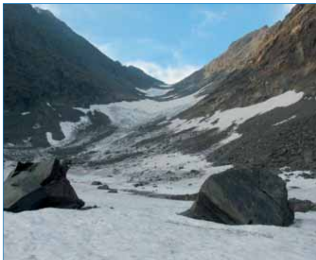
Рис. 7. Общий вид каровой лестницы ледника Разорванный на Байкальском хребте. На переднем плане каровый ледник Разорванный-3 северной экспозиции

Прошлое ледника Огдында-Маскит можно проследить с голоценового времени. В период климатического оптимума первой половины голоцена, когда среднегодовая температура существенно превышала современный уровень, ледник в верховьях долины р. Огдында-Маскит, вероятно, полностью растаял. Похолодание наступило в Восточной Сибири довольно резко и вызвало понижение снеговой линии, что при неизменном количестве осадков в условиях резко континентального климата вызвало увеличение длительности выпадения осадков в твердой фазе, а следовательно, увеличение размеров метелевого переноса и лавинного питания. В вершине троговой долины на подветренном склоне вдоль скальной стены вновь возник многолетний снежник, позднее сформировался присклоновый ледник, в котором ширина существенно превышала длину, а ось ледника была направлена на северо-восток в направлении метельного