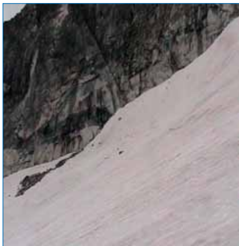
Рис. 4. Гладкие стены ледникового цирка способствуют аккумуляции снега в фирновом бассейне

части ледяного ядра и в подлежащем слое донной морены. Вечером перед заходом солнца термодатчики помещались в бергшруд на веревке на глубину 4 м, на дно шурфа глубиной 0,5 м в основании ледяного ядра и в шурф глубиной 0,3 м, пробитый среди камней донной морены. Утром до восхода солнца снимались показания приборов. Все термодатчики показали температуру -3,0 °С. Полученные близкие по величине значения объясняет одно из условий существования ледни-