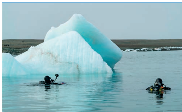
Водолазная группа на станции у обломка айсберга. Залив Микояна, о. Большевик. Экспедиция O2A2-2019: Северная Земля.

Геоморфологические и палеогеографические исследования по проекту МГУ выполняла группа под руководством Ф.А. Романенко. Группа провела 13 пешеходных маршрутов общей протяженностью около 160 км, береговая зона о-вов Визе и Ушакова была обследована дистанционно с помощью БПЛА. Составлено около 25 геолого-геоморфологических профилей, в том числе 10 — с геодезической точностью. С помощью БПЛА отснято 29 участков (сцен) общей площадью более 5 км 2 , создано 16 цифровых моделей рельефа и ортофотопланов общей площадью 2,6 км 2 , на четырех участках проведены массовые замеры трещиноватости (ориентировка и направление падения трещин) скальных пород. Собрана коллекция образцов (208 единиц) на разные виды изотопного датирования, а также на изотопно-кислородный, тефрохронологический, литологический и микрофаунистический анализы.