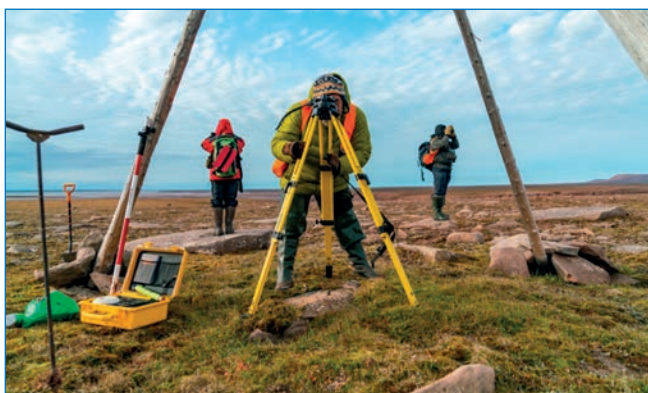
Геодезические работы. Берег залива Панфиловцев, о. Октябрьской Революции. Экспедиция O2A2-2019: Северная Земля.

архипелага Северная Земля, прибрежные мелководья больших островов архипелага, прибрежные воды небольших островов с сильными вдольбереговыми течениями, воды глубоководных проливов и заливов.