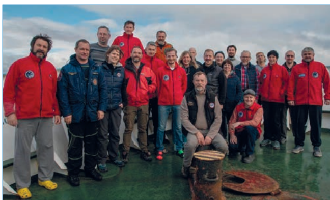
Члены экспедиции O2A2-2019: Северная Земля на борту НИС «Профессор Молчанов».