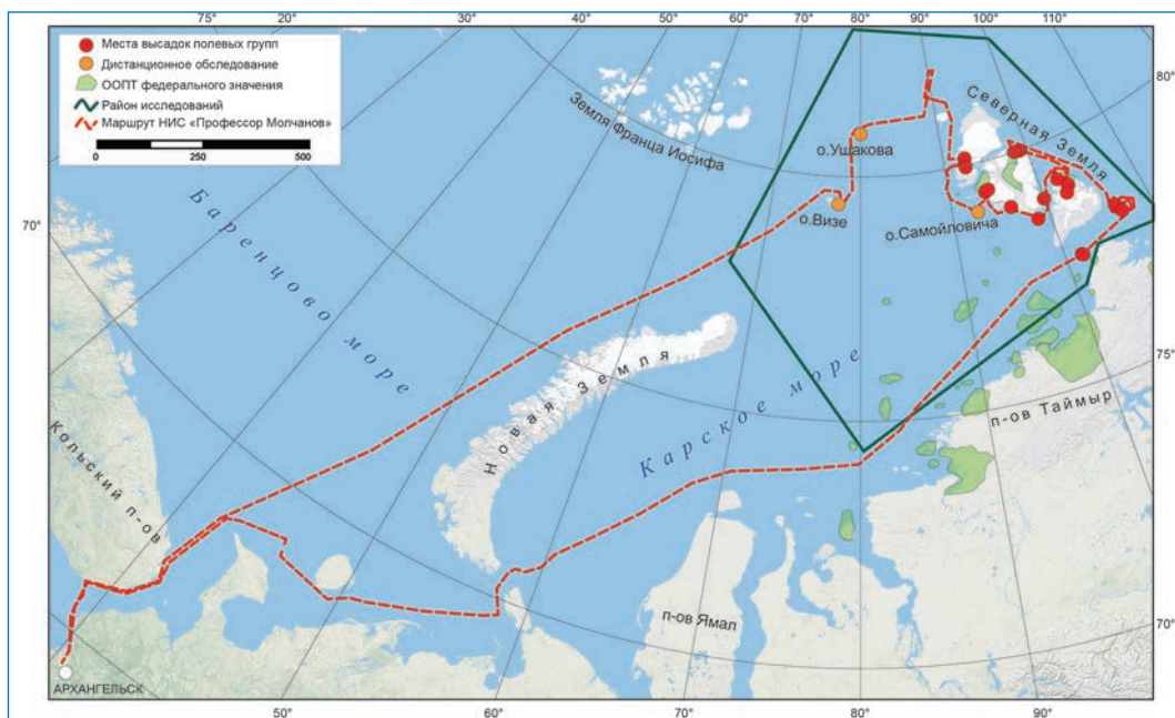
Маршрут и районы работ экспедиции O2A2-2019: Северная Земля

Атлантики, так и от Тихого океана. Эти земли, несмотря на значительную протяженность и близость к материковому побережью, были обнаружены всего 106 лет назад. Открытие Северной Земли в 1913 году стало последним крупным географическим открытием на планете. Вследствие удаленности и сложной ледовой обстановки на протяжении большей части года этот архипелаг и по сей день остается одним из наименее изученных районов Северного Ледовитого океана. Особенно это касается прибрежной зоны и морской островной экосистемы, а также объектов историко-культурного наследия. Но даже скудных данных достаточно, чтобы ученые и специалисты в области охраны природы единодушно при-