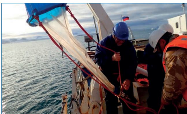
Судовые гидробиологические работы в экспедиции O2A2-2019: Северная Земля. Отбор проб зоопланктона сетью Джели.