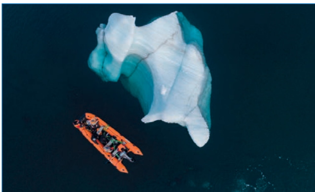
Водолазные гидробиологические работы в экспедиции O2A2-2019: Северная Земля. Водолазная лодка у обломка айсберга на станции № 26 у о. Большой Комсомольских островов.