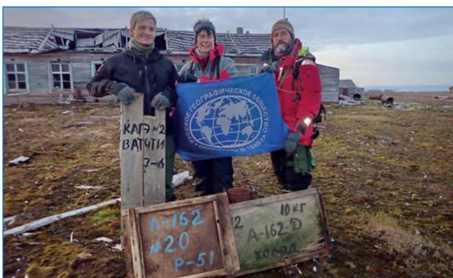
Участники экспедиции O2A2-2019: Северная Земля с артефактами на территории бывшего стационара КАГЭ и ААНИИ на мысе Ватутина, о. Октябрьской Революции.