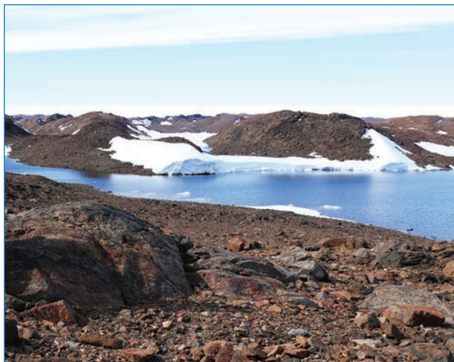
Оазис Бангера – оазис на побережье Антарктиды в западной части Земли Уилкса. Привлекает особое внимание российских геологов и геофизиков.

Г.Л. Лейченко, А.В. Голынский, Е.В. Михальский (ФГБУ «ВНИИОкеангеология»).