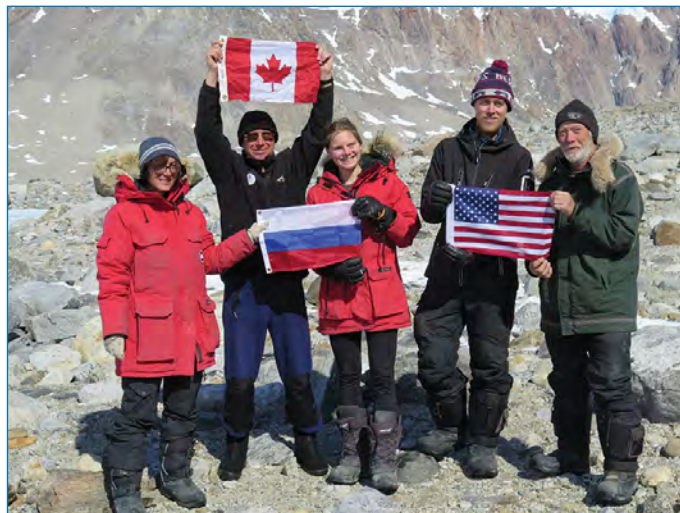
Участники экспедиции перед отъездом

Во многих пунктах обнаружить и собрать биологические материалы не удалось. Площадь таких «безжизненных» территорий в оазисе оказалась довольно значительной. Всего было собрано около 150 образцов лишайников, мхов и водорослей. Часть образцов взять в коллекцию не удалось либо из-за того, что они были слишком мелкими, либо