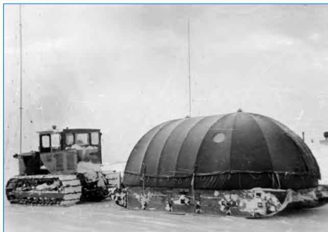
Перевозка палатки КАПШ-2, в которой будет оборудована аварийная база, в глубь шельфового ледника

В девяти километрах от расположения станции к юго-востоку был создан аварийный склад, на котором находились бензиновый двигатель, печь, портативная радиостанция, запас ГСМ, угля, продуктов из расчета на 1,5–2 месяца на семь человек, посуда, инструменты, кровати, спальные мешки. Его организация была связана с отсутствием опыта работы и жизни на шельфовом леднике советских полярников, которые в то время не знали природу откола айсбергов от его краевой зоны.