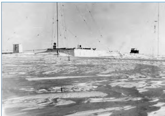
Общий вид станции Лазарев с северо-востока. 1 апреля 1959 года