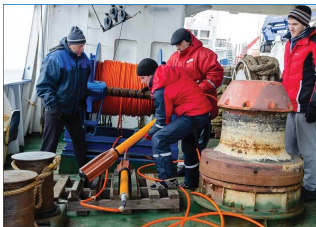
Магнитометр-градиентометр SeaSPY-2 на борту судна

обстановка, связанная с обилием дрейфующих ледяных полей и крупных одиночных айсбергов, особенно в южной части района работ. Однако, несмотря на объективные трудности, геофизическими маршрутами удалось пересечь основные структурные области, определяю-