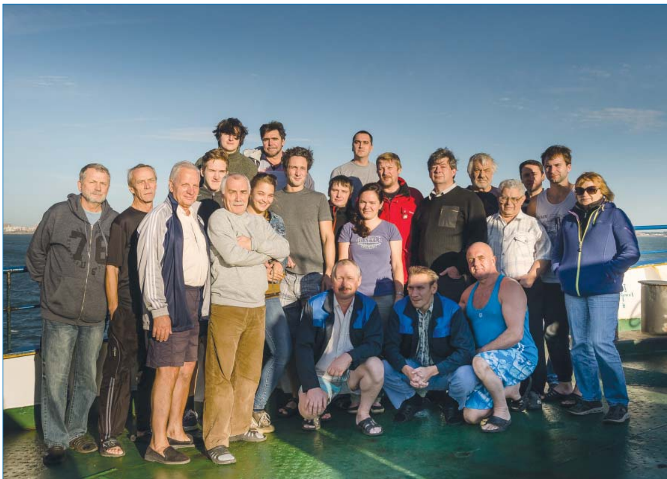
Полевой состав Антарктической геофизической партии после завершения работ

км пришлось на долю многолучевой эхолотной съемки на шельфе вблизи Южно-Оркнейских островов.