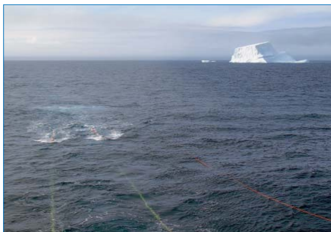
Одиночный айсберг, препятствовавший движению судна

щие строение района исследований и отражающие его геологическую эволюцию, — бассейны Пауэлл и Джейл, Южно-Оркнейский микроконтинент, поднятие Пауэлл. Все запланированные исследования выполнены в полном объеме. Общая протяженность геофизических профилей составила около 5200 км, из которых около 2500