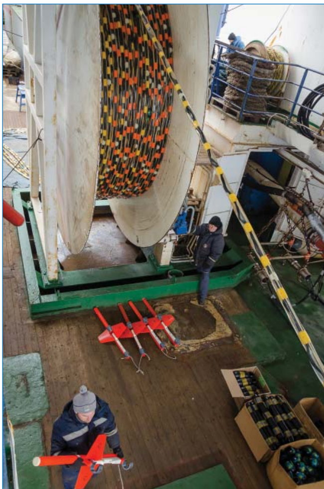
Сейсмическая коса и устройства контроля глубины

Для выполнения сейсмопрофилирования МОГТ в 63-й РАЭ использовалась сейсмическая коса с наиболь-