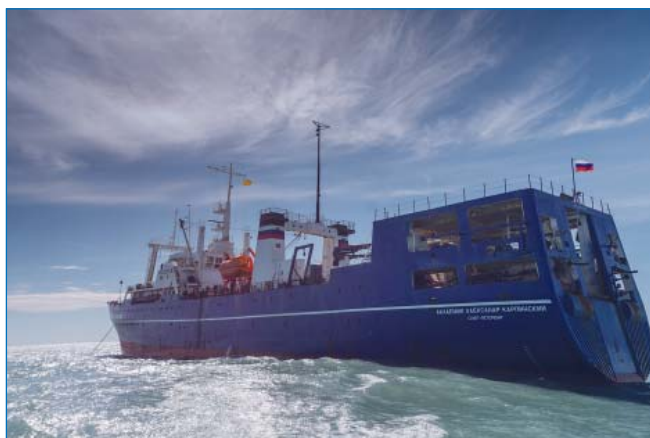
НИС «Академик Александр Карпинский» на рейде

1 — граница рамок отчетных карт 63-й РАЭ; 2 — профили комплексных геофизических исследований 63-й РАЭ; ЮОМ — Южно-Оркнейский микроконтинент; БП — бассейн Пауэлл; БД — бассейн Джейн; ЮХС — Южный хребет Скоша; СХС — Северный хребет Скоша; ЗХС — Западный хребет Скоша; ВХС — Восточный хребет Скоша; БПР — банка Пири; БДВ — бассейн Дав; ББ — банка Брюс; БДК — банка Дискавери