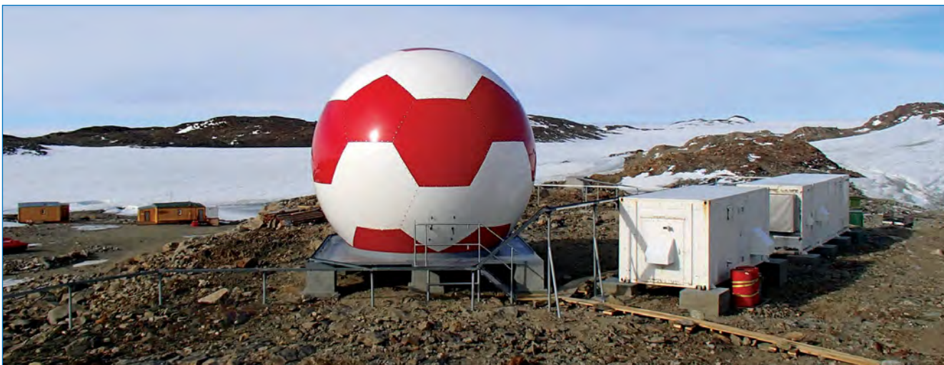
Новые комплексы оборудования системы ГЛОНАСС на станции Новолазаревская.

– исследования динамики и мониторинга вечномёрзлых грунтов на береговых станциях и базах РАЭ;