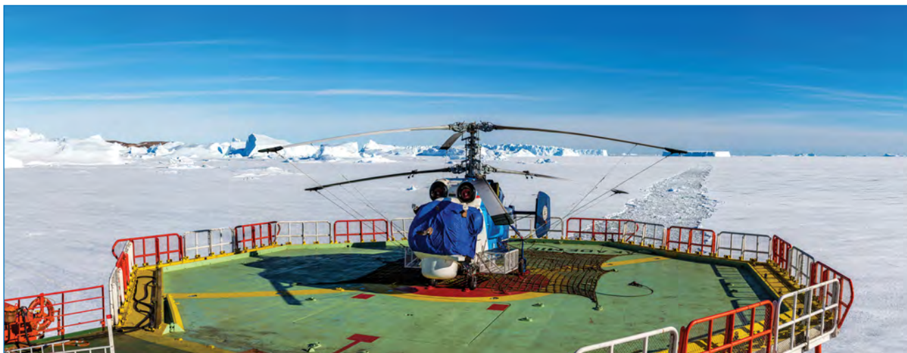
Выбор места подхода судна к ледовому барьеру моря Рисер-Ларсена.

После консультаций между судовладельцами обоих судов и руководством Индийской антарктической экспедиции (ИАЭ) было решено, что НЭС «Академик Федоров» вначале проследует по своей программе на станцию Мирный и в район сезонной полевой базы «Оазис Бангера» для завершения плановых сезонных операций, а затем вернется в район нахождения т/х «Иван Папанин» для оказания дальнейшей помощи аварийному судну. В период с 7 по 19 февраля НЭС «Академик Федоров» завершило все плановые операции и вернулось в район станции Прогресс. 20 февраля дрейфующий лед из бухты Куилти, где стояло аварийное судно, был вынесен, что по-