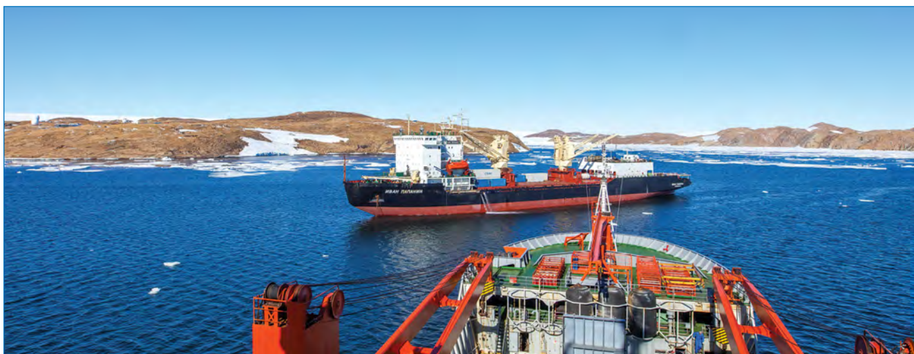
Сближение НЭС «Академик Федоров» и т/х «Иван Папанин» для проведения водолазных работ в бухте Куилти.

– совместно с сотрудниками ряда германских научных организаций были выполнены совместные геохимические исследования в районе оазиса Ширмахера (станция Новолазаревская), биологические исследования на о. Кинг Джордж (станция Беллинсгаузен);