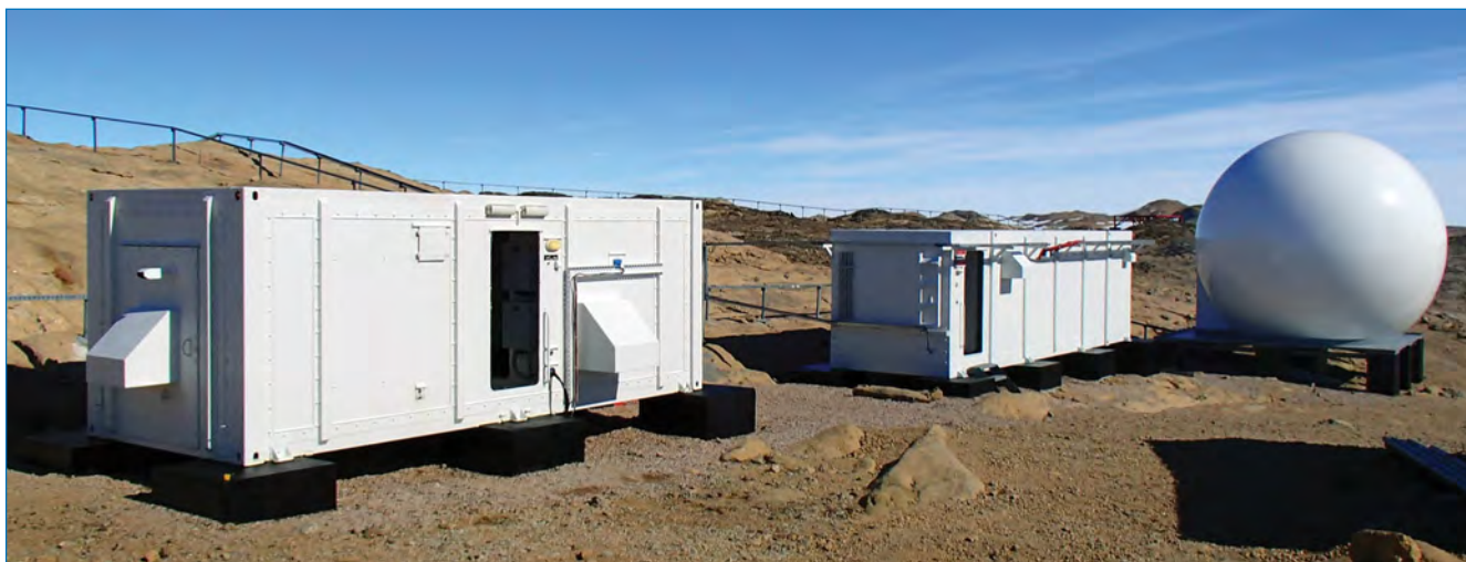
Новые комплексы оборудования системы ГЛОНАСС на станции Прогресс.

– продолжилось международное сотрудничество РАЭ в рамках выполнения программы DROMLAN совместно с национальными антарктическими экспедициями Бельгии, Великобритании, Германии, Индии, Нидерландов, Норвегии, Финляндии, Швеции, ЮАР и Японии, использующими ледовый аэродром и пассажирский терминал станции Новолазаревская;