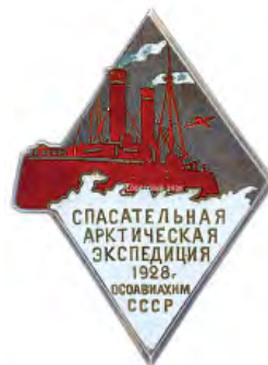
Знак участника спасательной арктической экспедиции ледокола «Красин». 1928 год.

После операции по спасению экипажа Умберто Нобиле, которая имела широкий международный резонанс, на этот сюжет были сняты фильмы и написаны книги. Один из самых известных фильмов — «Красная палатка» (1969), снятый совместно СССР, Италией и Великобританией. В нем К.П. Эгги играет народный артист Эстонской ССР Рейно Арен (1927–1990). По возвращении экипаж «Красина» спас моряков и пассажиров затертого во льдах круизного судна «Monte Servantes». «Красин» под командованием К.П. Эгги поставил рекорд свободного плавания в арктических широтах, достигнув 81° 47' с.ш.