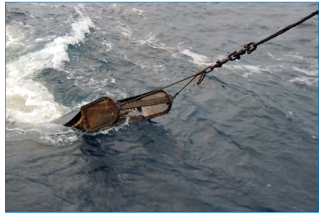
Подъем трала Сигсби на борт НИС «Дальние Зеленцы» в Баренцевом море.