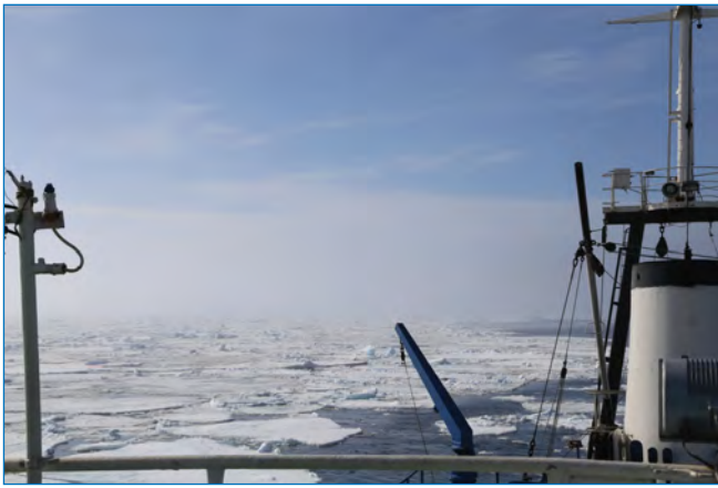
НИС «Дальние Зеленцы» в районе кромки льда в Баренцевом море.