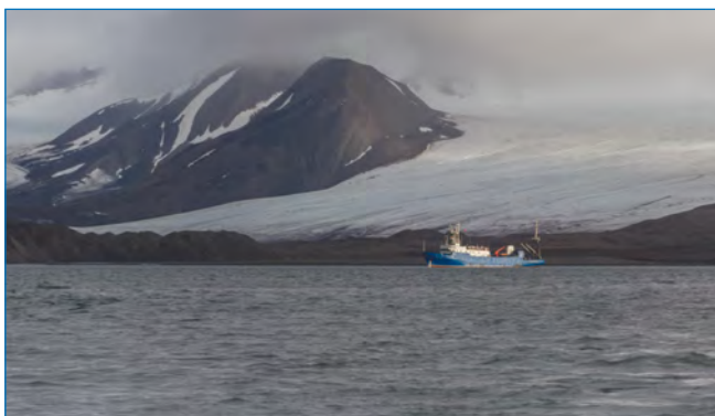
НИС «Дальние Зеленцы» в заливе Грэн-фьорд на архипелаге Шпицберген.

Морские исследования на борту НИС «Дальние Зеленцы» в Ис-фьорде стали хорошим примером международного и межведомственного взаимодействия на Шпицбергене. В съемке приняли участие десять ученых из ММБИ, двое — из ААНИИ и двое — из UNIS.