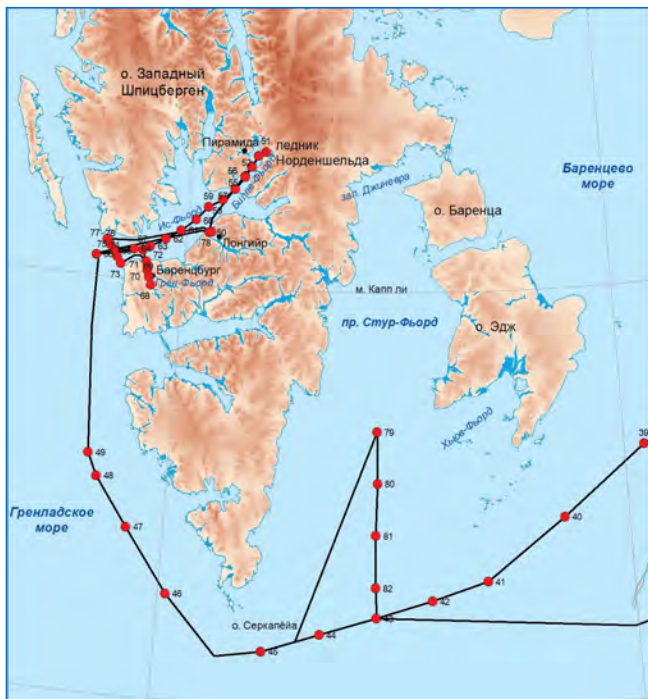
Станции и маршрут НИС «Дальние Зеленцы» в районе архипелага Шпицберген

Лов зоопланктона осуществлялся сразу четырьмя видами сетей: Джели, WP2, MultiNet midi, ИКС. Донный осадок на содержание искусственных радионуклидов и для взятия проб макрозообентоса отбирался дночерпателем ван Вина. На всей исследуемой акватории велись трансектные визуальные наблюдения за морскими птицами и млекопитающими.