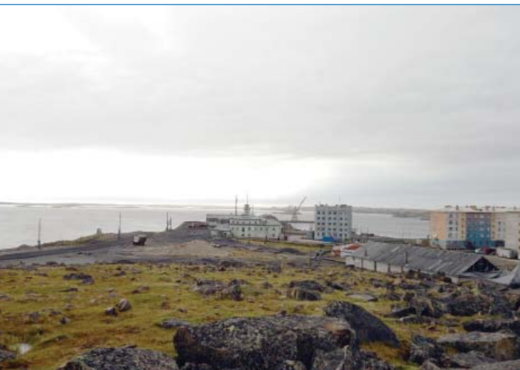
Вид на поселок Диксон с Южной горы