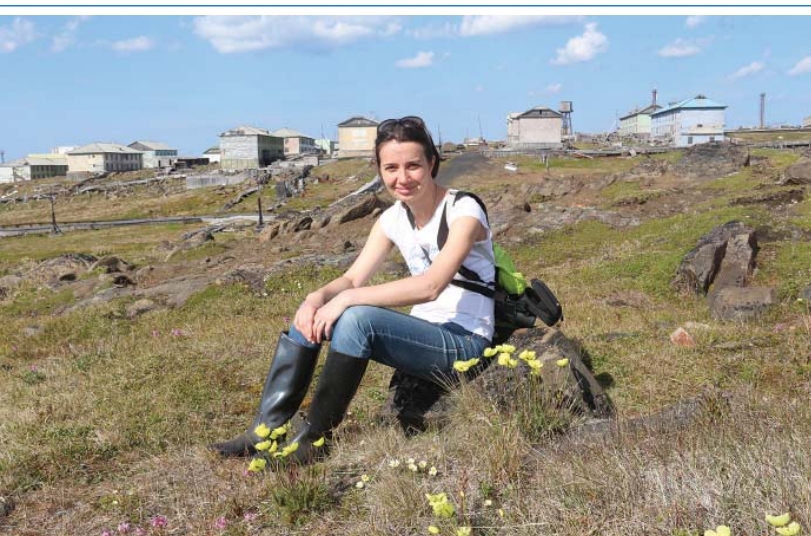
Диксон порадовал солнцем и теплом

В последний день моего пребывания в Арктике Диксон сделал мне необычный подарок. Все дни до этого температура воздуха колебалась около 0 °С. Но здесь, в Арктике, много зависит от направления ветра. И сегодня он подул с материка, принес с собой тепло. И не просто тепло, а сразу +20 градусов! Для таких явлений в этих широтах даже существует специальное мероприятие — «активировка», то есть когда взрослых