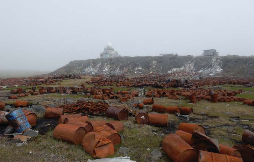
Типичная для арктического поселка картина. Пустые бочки от дизельного топлива