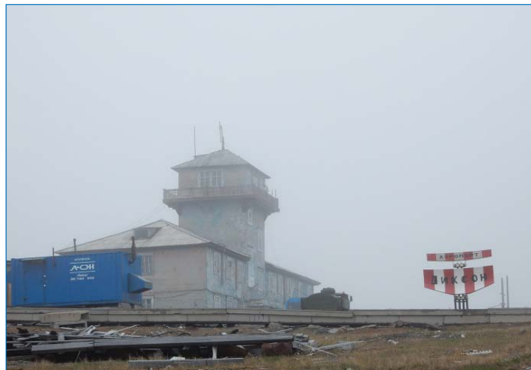
Аэропорт Диксон на островной части поселка

На следующее утро друзья не дали мне долго разлежаться: время пребывания на Диксоне было ограничено, а посмотреть нужно много.