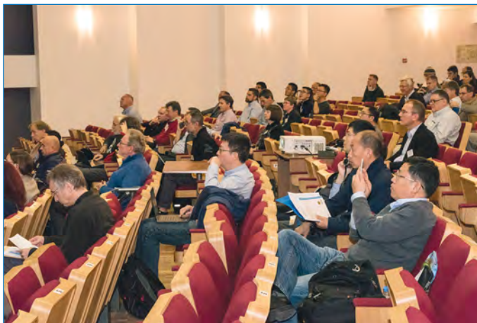
В зале заседаний совещания

В частности, обсуждались вопросы использования НЭС «Академик Трёшников» для обеспечения и поддержки плавания НИЛ «Поларштерн» в 2019 году, включая его обеспечение дизельным топливом ледоколами «Росморпорта», а также ротацию его персонала ледоколами и авиацией с использованием