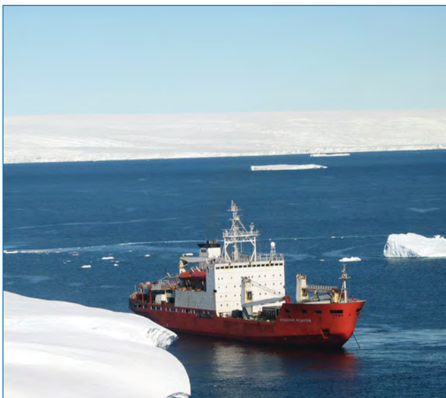
НЭС «Академик Федоров» вблизи станции Мирный, море Дэйвиса.

и материковый склон в морях Содружества, Рисер-Ларсена, Амундсена и Беллинсгаузена. Всего, с учетом работ в 2010 и 2011 годах, сделана 91 станция, на 46 из них проводился отбор проб для определения содержания растворенного кислорода, кремния, фосфатов, нитратов, нитритов и аммиака. В январе 2007 года выполнено три меридиональных океанографических разреза в восточной части моря Содружества, включая залив Прюдс (по 62, 64 и 70° в.д., всего 29 зондирований от поверхности до дна океана), в феврале 2007 года — разрез в море Рисер-Ларсена по 15° в.д. (13 зондирований), в феврале 2008 года — разрез в море Амундсена (15 зондирований), в феврале 2010 года — разрез в море Беллинсгаузена (16 зондирований), в январе 2011 года — повторное выполнение разреза по 70° в.д. в восточной части моря Содружества (18 зондирований). Все перечисленные разрезы отличаются высоким пространственным разрешением, особенно в области материкового склона. Расстояние между станциями на склоне уменьшалось до 2 км, что дало возможность получить подробную картину структуры вод этого района.