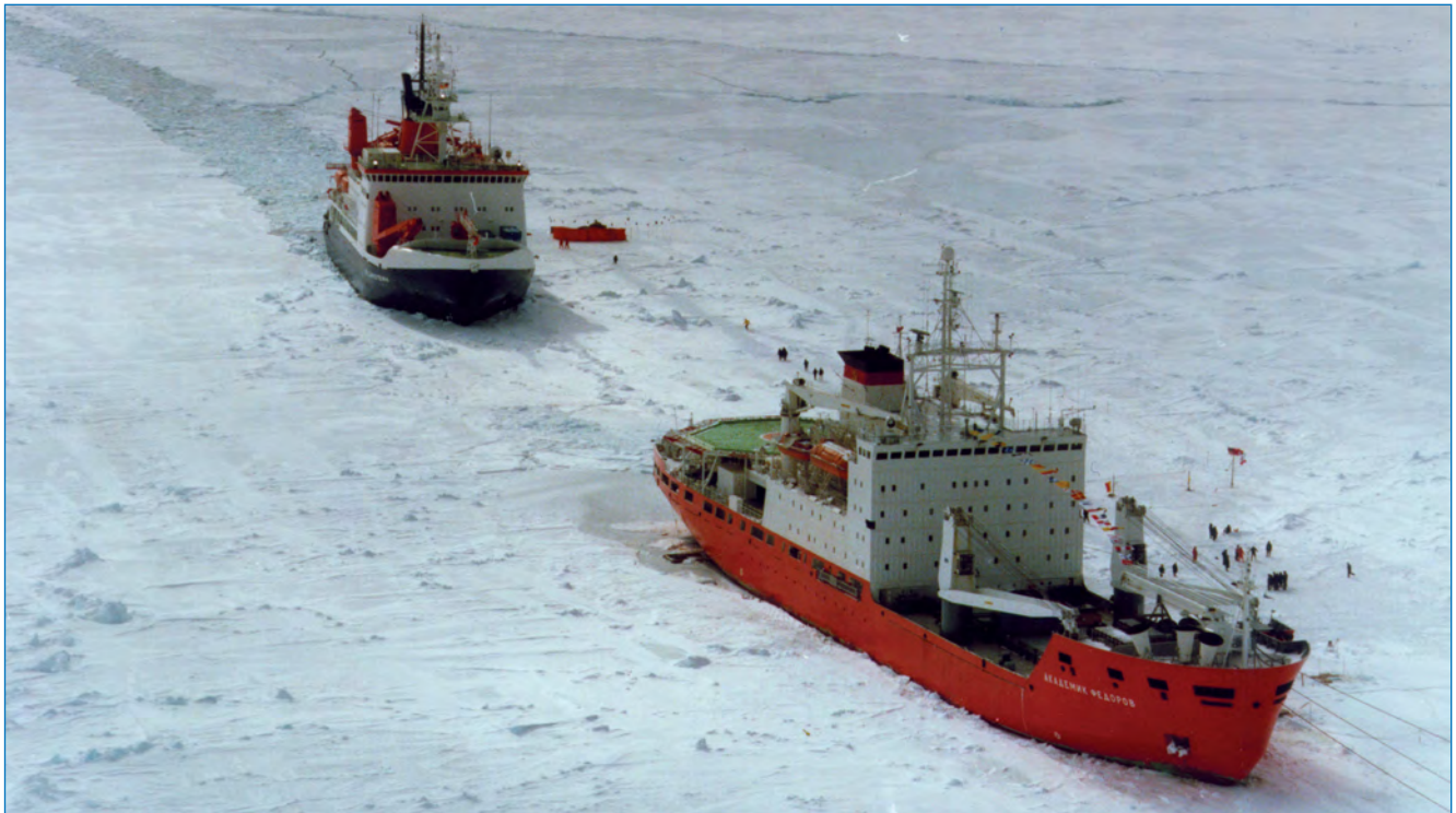
НЭС «Академик Федоров» и НИЛ «Поларштерн» во льдах круговорота Уэдделла (октябрь 1989 года).

дрейфующей станции и совместно с НИЛ «Натаниэль Палмер» обеспечившее ее эвакуацию.