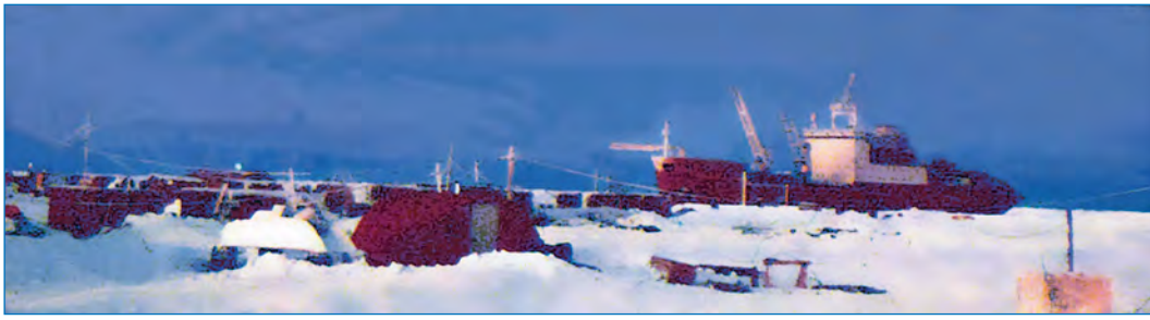
НЭС «Академик Федоров» у льдины станции «Узделл-1».

океана в формировании прошлого, настоящего и будущего климата, включая взаимосвязи между зональной и меридиональной циркуляциями, трансформации водных масс, взаимодействие между океаном и криосферой, и, наконец, получить обоснование концепции создания экономически эффективной системы наблюдений для южной полярной области.