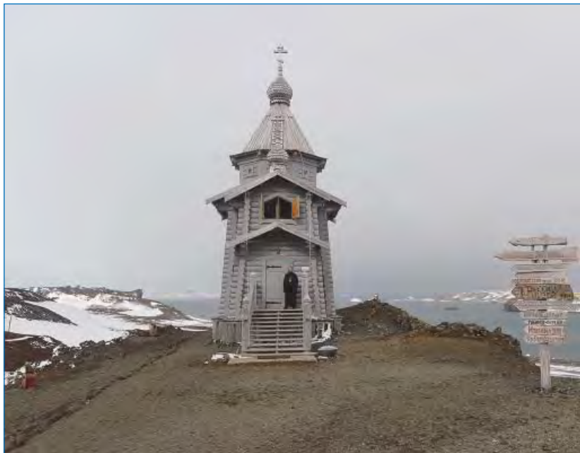
Русский православный храм в честь Пресвятой Троицы на станции Беллинсгаузен.

Его Святейшеству сослужили епископ Горноалтайский и Чемальский Каллистрат, бывший первым священнослужителем, регулярно окормлявшим станцию Беллинсгаузен после постройки Троицкого храма в 2004 году, и иеромонах Вениамин (Мальцев), окормляющий членов российской экспедиции в настоящее время.