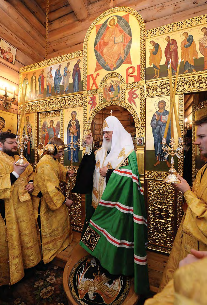
Святейший Патриарх Кирилл совершает водосвятный молебен.

Богослужбные песнопения исполнил хор духовенства Московской епархии (регент — священник Сергей Голев).