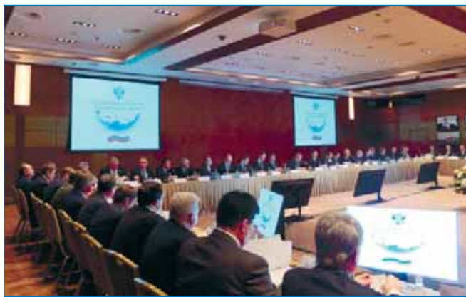
Рабочий момент заседания.

Напомним, что Правительство РФ в марте утвердило постановление о создании Госкомиссии по Арктике. За-