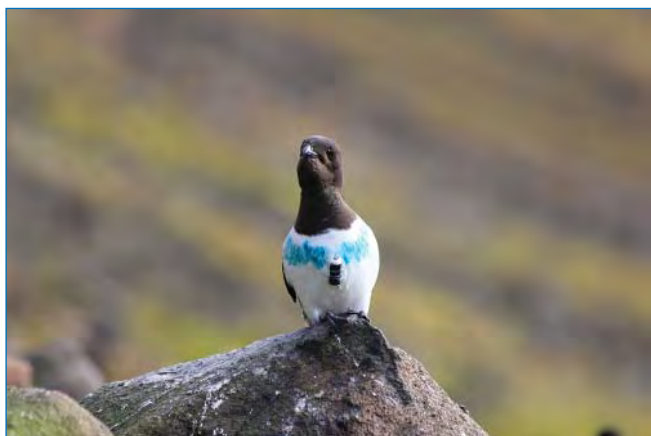
Люрик с логгером температуры, давления и солености.