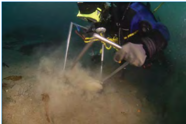
С. Гребельный отбирает пробу зообентоса с помощью зубчатого водолазного пробоотборника Грузова.

Гидрологические и гидробиологические работы велись в дрейфе на глубинах от 30 до 554 м, преимущественно в основных проливах между островами. Всего выполнено 20 полных комплексных станций (гидрологический вертикальный разрез, отбор фитопланктонных