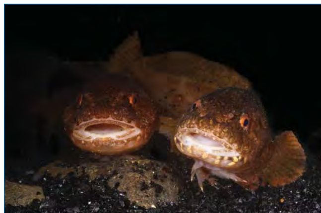
Пара бурых липарисов Liparis tunicatus .

Отдельный проект Французского института полярных исследований (исполнители Дэвид Гремье и Жером Форт (Dr. David Grémillet и Dr. Jerome Fort)) был посвящен эко-