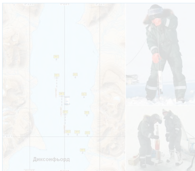
Положение океанографических станций, выполненных в заливе Диксонфьорд, рабочие моменты.

в составе CTD-регистратора SBE-37SM, 15-метровой термокосу с интервалом установки датчиков 0,75 м и акустического доплеровского профилографа течений Teledyne RD Instruments Workhorse Sentinel 300 КГц. Станции осуществляли регистрацию параметров состояния морской воды с интервалом 20 минут в течение 76 часов. С припайного льда в бухте Адольфа в тестовом режиме была выполнена регистрация микроструктурных пульсаций температуры и скорости течений на вертикальном профиле с использованием профилографа микроструктуры ISW Wassermesstechnik MSS60.