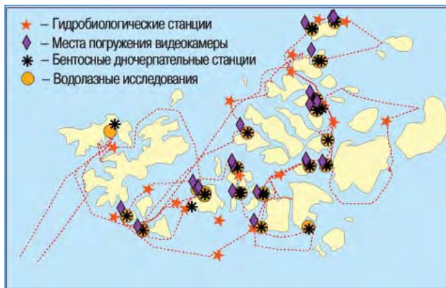
Рис. 2. Маршрут экспедиции и районы морских работ. Красный пунктир – маршрут судна.

димые согласования, собрать международную команду ученых и документалистов, найти судно, подготовить снаряжение и оборудование.