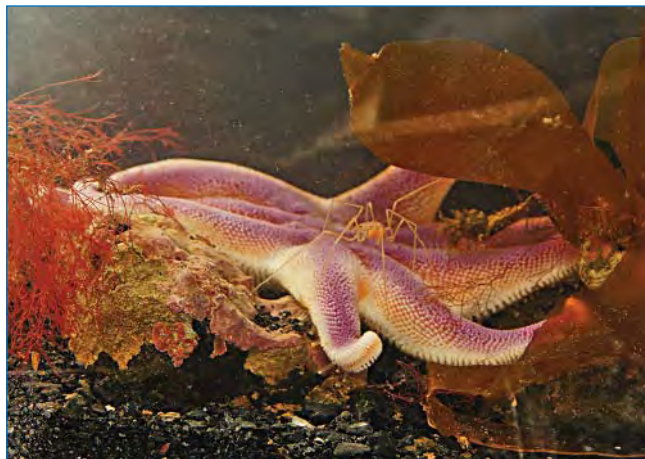
Морская звезда Solaster glacialis .