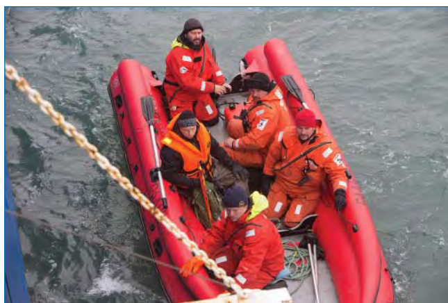
Группа сопровождения научных работ швартуется к борту судна.