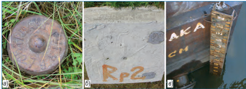
Основной (а), контрольный (б) реперы и уровнемерная рейка (в) станции Сеяха.