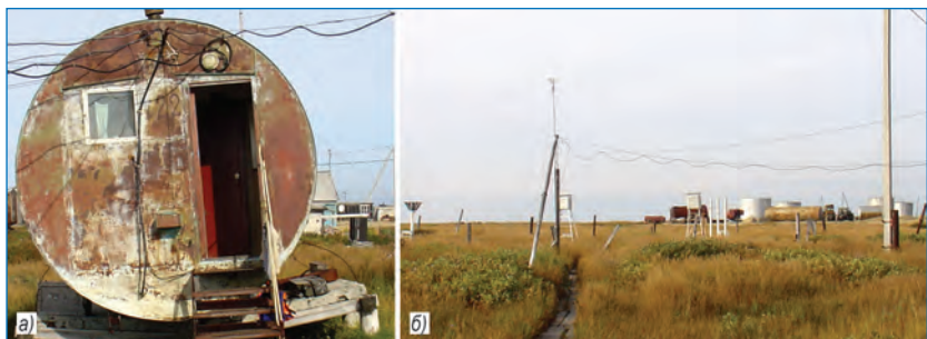
Общий вид гидрометеостанции Новый Порт (а) и метеоплощадки (б).