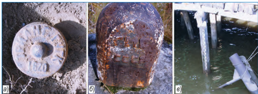
Контрольный (а), основной (б) реперы и водомерная рейка (в) станции Новый Порт.