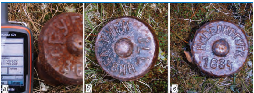
Исходный репер ГУГК (а), основной (б) и контрольный (в) реперы станции Тамбей.