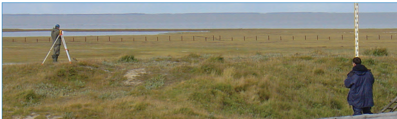
Нивелирование реперов высотной основы гидрометеостанций.

Кроме топогеодезических работ в задачи группы входило рекогносцировочное обследование территории станций, сбор сведений о состоянии и репрезентативности пунктов наблюдений и наличии необходимой документации на станциях, нормативном и программ-