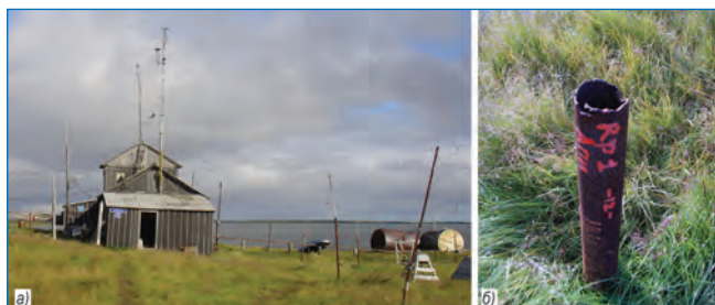
Общий вид метеостанции (а) и реперы на метеорологической площадке (б) поселка Гыда.