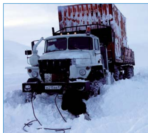
Транспортировка груза на озеро Эльгыгытгын зимой 2008 г.