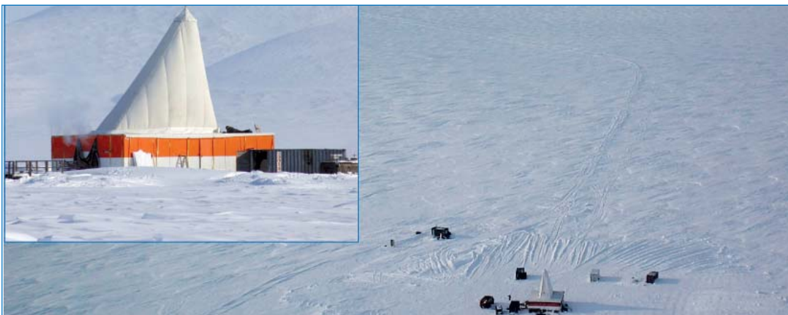
Буровая платформа на льду озера Эльгыгытгын.

К настоящему моменту в лабораториях России, Германии и США проведен комплексный анализ керна озерных отложений, включающий литологическое описание, геохимические анализы, палеоботанические анализы, кислородно-изотопный