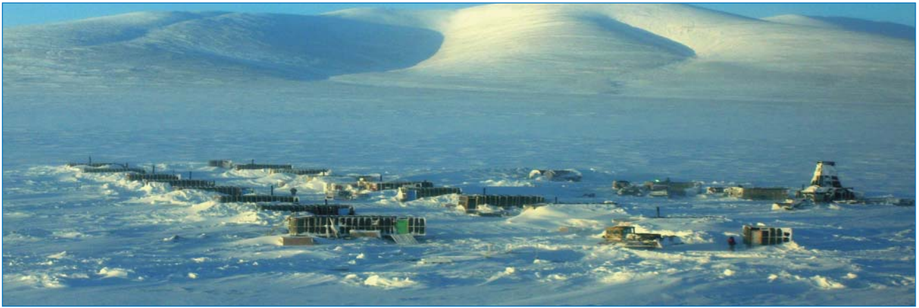
Вид на буровой поселок на побережье озера Эльгыгытгын зимой 2009 г.

и финансовых трудностей. Предстояло скоординировать усилия финансирующих и контролирующих организаций различных стран. Сами же работы необходимо было выполнить в суровых условиях арктической зимы при полном отсутствии инфраструктуры (значительная удаленность от населенных пунктов, отсутствие каких бы то ни было дорог).