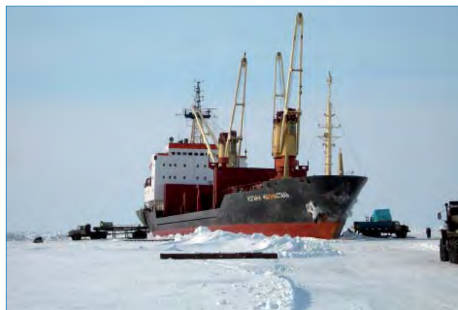
Выгрузка на припай, мыс Харасавэй, т/х «Иоганн Махмасталь», апрель 2008 г.