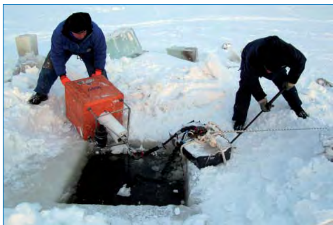
Постановка автономной донной станции с припайного льда, п. Сабетта, март 2011 г.