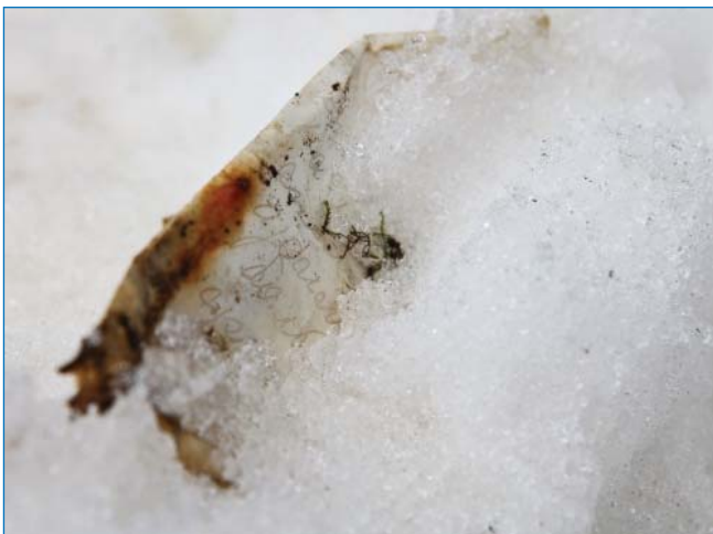
Отдельный листок из дневника участника экспедиции (написан еще на «Св. Анне» в 1913 г.). Место находки недалеко от основных костей скелета в маленьком ледничке у подножья морены

значный вывод, что этого человека никто не хоронил, более того, его даже не укладывали просто на камнях как обычно укладывают покойников. Значит ли это, что в момент своего смертного часа он был один? Или его спутники были уже настолько обессилены, что просто физически не смогли этого сделать?