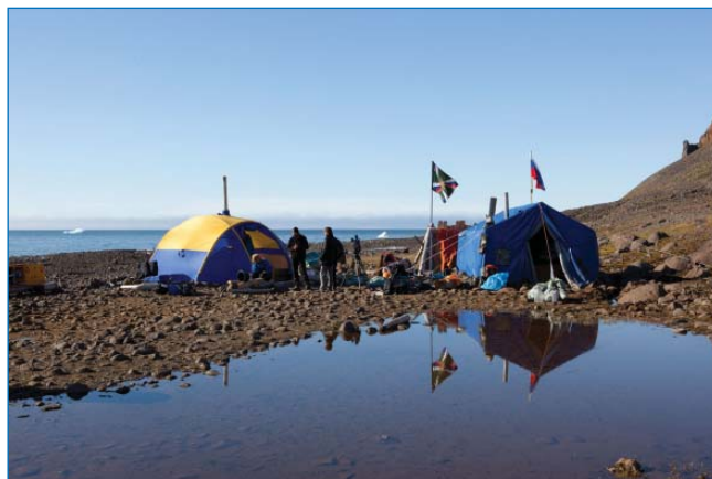
Лагерь экспедиции «По следам “Двух капитанов”» на острове Земля Георга

Арктика встретила нас жестким ветром, доходящим в порыве до 30 м/с, температурой минус 2 °С и неприятной изморосью. В течение нескольких часов одиннадцать здоровых мужиков ставили спальную палатку – на таком ветру занятие не из веселых. Порой возникали сомнения, удастся ли вообще ее установить в такую погоду, но выбора не было: вертушки улетели, спускался туман, и на сегодня помощи со стороны больше не будет. А ветер все свежел, достигая силы жестокого шторма, вспененное море клоками врзалось в низкий берег. Установку заканчивали уже под завывание вьюги. Несмотря на погоду, пришлось, тем не менее, провести разведку местности вокруг лагеря на предмет наличия «соседей». Медвежьих следов в окрестности мы, к нашему великому удовольствию, не нашли. Кое-где между