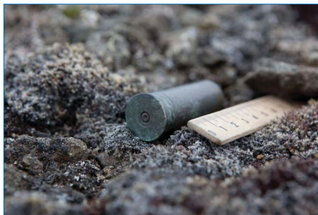
Гильза 12-го калибра экспедиции Фредерика Джексона в 1893–1896 гг. на ЗФИ. Найдена в гурии на скалах над нашим базовым лагерем

ни основного письма, ни остатков деревянного ящика с продуктовым депо, оставленным англичанами, найти так и не удалось.