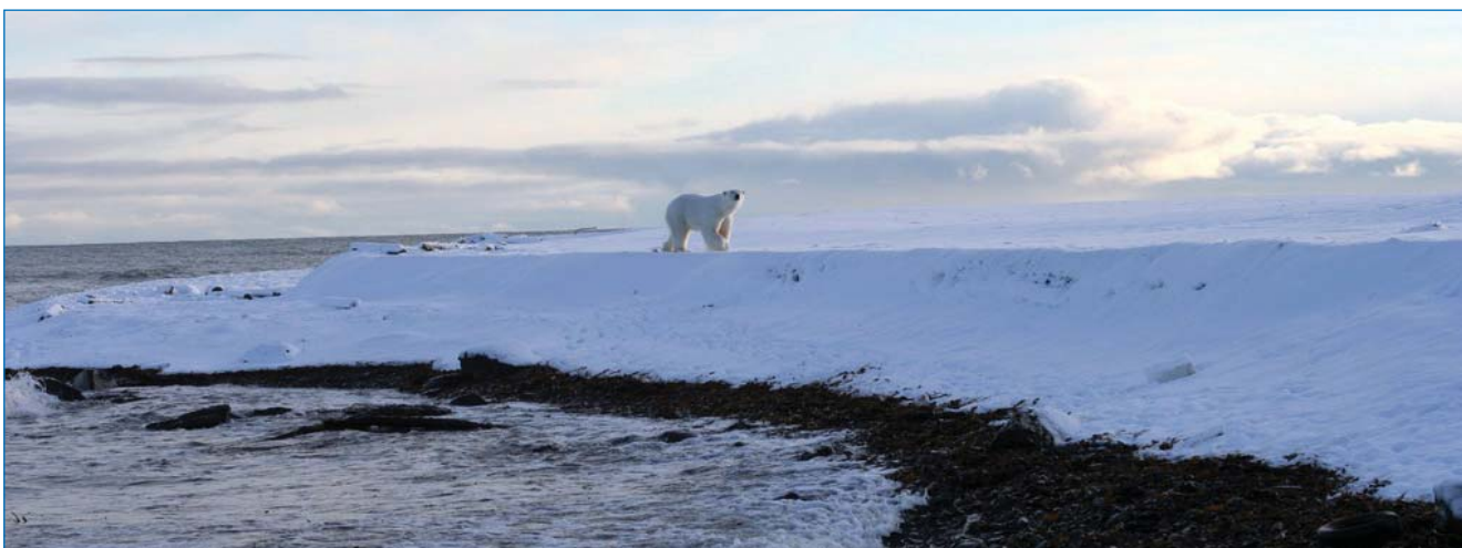
Ледяная гавань. Пейзаж с медведем.

М.В. Гаврило (ААНИИ; Национальный парк «Русская Арктика»)