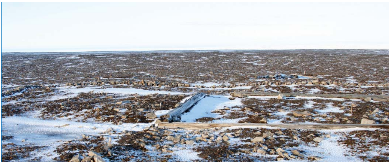
Ледяная гавань. Место зимовки экспедиции Баренца.

олень самостоятельного новоземельского подвида, все перечисленные млекопитающие занесены в Красную книгу РФ. Среди ценных геологических объектов следует упомянуть разрезы верхнепротерозойских и палеозойских толщ на берегу заливов Иностранцева и Екс и в некоторых других местах.