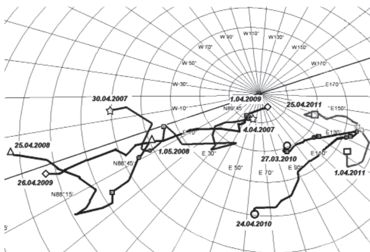
Рис. 1. Дрейф Панарктической ледовой экспедиции в 2007–2011 гг. в околополюсном районе СЛО. Время и координаты отбора проб приведены в табл. 1.

фильтрующим конусом из капронового сита с размером ячеек 150 мкм. Лов протяженностью 25 м осуществлялся по нижней поверхности льда так, чтобы выдыхаемый водолазом воздух не попадал на облавливаемую поверхность. Для этих целей сачок максимально удалялся от водолаза в момент лова. Протяженность лова оценивалась по длине маркированного страховочного фала, выпускаемого от границы лунки к водолазу. После окончания лова входное отверстие сачка перекрывали и пробу поднимали на поверхность.