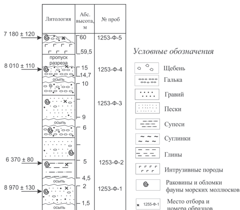
Рис. 3. Разрез голоценовых отложений на о. Вильчека в т.н. 1253. Слева от литологической колонки показаны радиоуглеродные датировки.