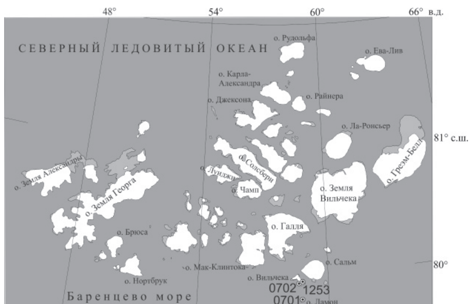
Рис. 1. Положение датированных голоценовых морских террас.