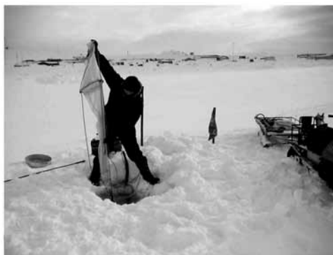
Рис. 2. Рабочий момент отбора проб сетного планктона

Пресноводный вид копепод – Pseudoboeckella poppei ( Calanoida , рис. 3) – был выбран для проведения серии экспериментов в силу высокой численности вида в водоеме, яркой окраски и крупных размеров, что облегчает работу с ним в лабораторных условиях.