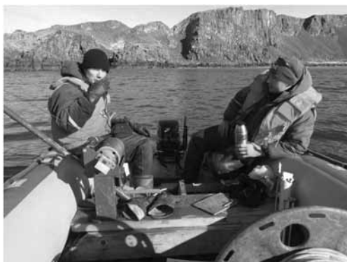
Рис. 4. Во время экспозиции термометров на станции I

Соленостная стратификация водной толщи в точках отбора в период открытой воды была выражена значительно слабее (табл. 2). Однако в большинстве слу-