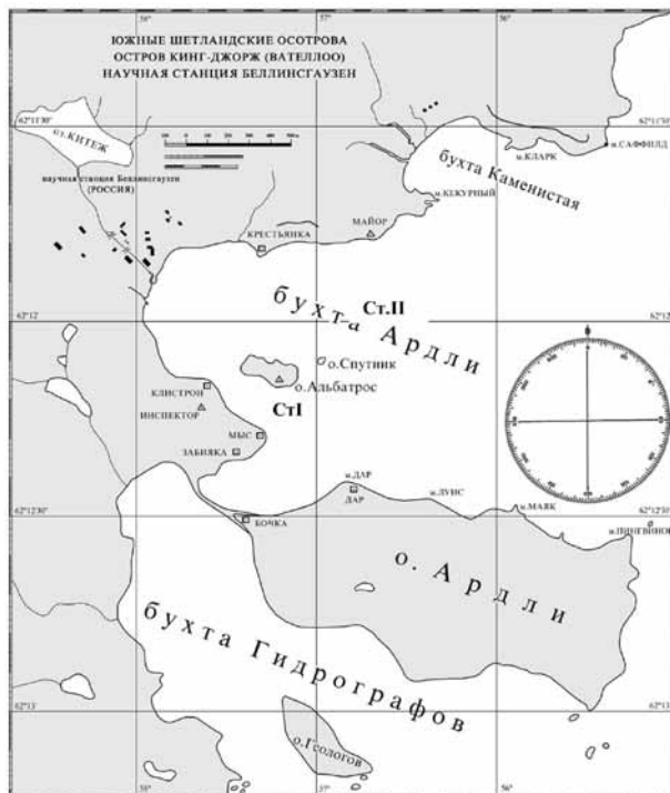
Рис. 1. Расположение планктонных станций (Ст. I и Ст. II) в бухте Ардли

бирали с поверхности. В слое 0–5 м кислородным датчиком Марк-201 было измерено содержание кислорода. В декабре 2007 г. в озере по слоям было измерено содержание в воде органической взвеси. Взвесь осаждали на фильтры марки MGF и в последующем обрабатывали аналогично методике определения калорийности копепод (см. ниже).