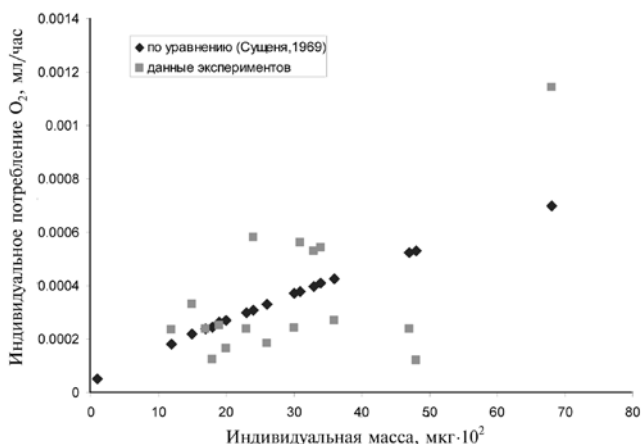
Рис. 8. Результаты экспериментов по определению индивидуального потребления кислорода Pseudoboeckella poppei (в пересчете для 20 °С)

Особенностью существования популяции Pseudoboeckella poppei в озере Китеж является полное отсутствие хищников, поедающих бокеллю. Это приводит к любопытной перестройке характеристик роста рачков. После достижения рачками половозрелости (при длине 1,95–2 мм) у них не происходит торможения сомати-