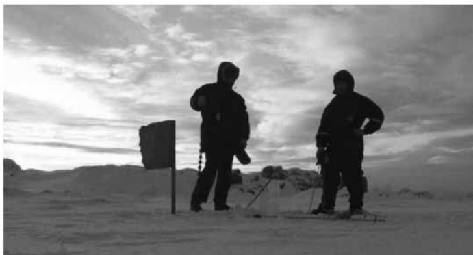
Рис. 6. Первый выход на припай 21.06.2007

Значительную роль в планктонном сообществе бухты Ардли играют меропланктонные организмы. Наиболее многочисленным компонентом меропланктона, отмечаемым круглый год, являются яйца и личинки Ascidia (максимум числен-