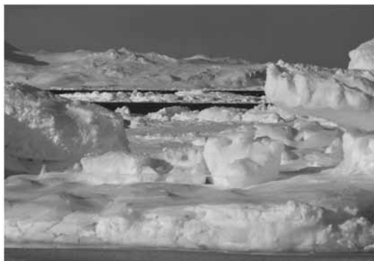
Рис. 5. Необычно раннее появление плавающего льда в бухте Ардли (15.04.2007)

В течение всего года доминирующим по численности видом сетного зоопланктона был представитель отряда Cyclopoida (класс Copepoda ) Oithona similis . Данный вид распространен всесветно и играет заметную роль во многих прибрежных морских экосистемах. Максимальная численность ойтоны в пересчете на 1 м 2 была зарегистрирована в зимний период (до 2900 экз./м 2 ). В период открытой воды численность вида значительно снижалась вплоть до полного отсутствия в пробах. В пробах отмечались в основном старшие копеподиты и половозрелые