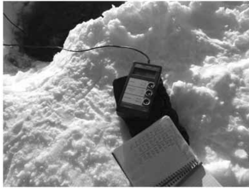
Рис. 9. Измерение содержания кислорода в озере Китеж датчиком Марк-201

держание растворенного кислорода в верхнем 4,5-метровом слое воды в центре озера, по данным измерений анализатора растворенного кислорода «Марк-201», приведены в табл. 6.