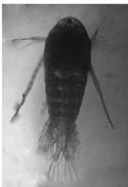
Рис. 3. Pseudoboeckella poppei – доминантный вид зоопланктона озера Китеж

Индивидуальное потребление кислорода Pseudoboeckella poppei определяли методом экспозиции в респирометрах объемом 120 мл в течение суток в лабораторных условиях с последующим определением концентрации кислорода методом Винклера. Определение индивидуального потребления кислорода методом экспозиции в респирометрах объемом 120 мл было связано с методическими трудностями. Электрохимический метод определения кислорода прибором Марк-201 оказался непригоден для измерения столь малой разницы концентрации кислорода. Нижний предел чувствительности метода определения кислорода по Винклеру (0,05 мг/л) оказался выше, чем суточная индивидуальная потребность в кислороде псевдобокелли при температурах 5–10 °С. Было установлено, что используемые в опытах антибиотики вносят значительную погрешность в определение кислорода по Винклеру, являясь сильными восстановителями. В ходе экспериментов была определена методика корректного определения дыхания ракообразных с использованием в одном опыте нескольких (3–5 шт.) ракообразных одинаковой массы. Для отбора ракообразных использовали кратковременную наркотизацию копепод 1 % лидокаином. Опыты проводили в природной воде, профильтрованной через мембранный фильтр Владипор № 2. Для учета дыхания бактерий использовали метод холостой пробы. Опыты проводили при температуре 10–12 °С в емкости с водой. Экспозиция опытов составляла 20–25 ч.