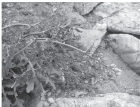
Рис. 4. Растение, обнаруженное на станции Прогресс летом 2014/15 г., Rorippa palustris .

Восточная Антарктида. Земля Принцессы Елизаветы, Берег Ингрид Кристенсен, Холмы Ларсеманна, территория станции Прогресс, нижняя часть склона восточной экспозиции, 69°23'30" ю.ш. и 76°23'90" в.д., 30 м над уровнем моря, 9.02.2015. Собрал К.М. Андреев, гербарий Ботанического института (LE) (рис. 4).