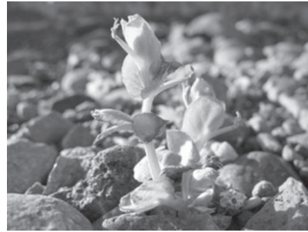
Рис. 2. Бобовое, возможно — Pisum sativum , обнаруженное на станции Беллинсгаузен в 2006 г.

Растение из семейства Fabaceae было обнаружено также и в континентальной Антарктике — летом 2005/06 г. на территории индийской станции Майтри в оазисе Ширмахера (Dutta et al., 2007). Судя по приводимому в публикации снимку, оно вполне развилось и достигло довольно больших размеров. Позднее выяснилось, что это пророс также горох посевной, очевидно просыпанный из мешков, транспортировавшихся на склад индийской станции.