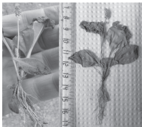
Рис. 8. Растение, обнаруженное на станции Новолазаревская летом 2012/13 г. Plantago major (живые и гербаризированные образцы).

Chenopodium rubrum L. — Марь красная. Циркумбореальный прибрежно-сорный вид умеренных широт. Широко распространенный на северо-западе России вид. Прогресс (Hughes, Convey, 2012).