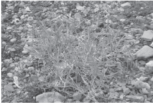
Рис. 1. Злак Poa sp., выросший на территории китайской станции Великая стена (о. Кинг Джордж, Южные Шетландские о-ва) в 2006 г.