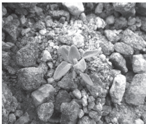
Рис. 7. Растение, обнаруженное на станции Новолазаревская летом 2012/13 г. Chenopodium album .