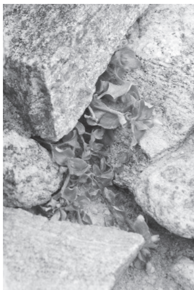
Рис. 6. Растение, обнаруженное на станции Прогресс летом 2013/14 г. Stellaria media .

Stellaria media (L.) Vill. — Звездчатка средняя, мокрица. Субциркумбореальный сорный вид умеренных и тропических широт, широко распространенный по всему земному шару. В Антарктиде обнаруженное растение развилось до стадии бутонизации и сформировало заметное количество цветков. Российская научная станция Прогресс (Hughes, Convey, 2012). Прогресс, 2013–2014.