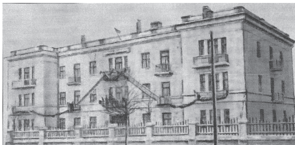
Рис. 1. Здание АНИИ в Красноярске в 1941–1944 гг.

Осенью 1941 г. Государственным Комитетом обороны (ГКО) было принято решение об эвакуации организаций ГУСМП в Красноярск. В это период началась эвакуация и Арктического института. В Красноярске он был размещен по адресу ул. Маркса, 103 (рис. 1) (Андреев, Дукальская, Фролов, 2010).