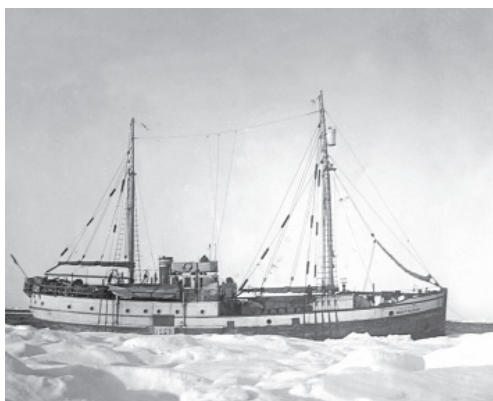
Рис. 4. Научно-экспедиционное судно АНИИ «Академик Шокальский».

В период экспедиции судно приняло участие в спасении моряков конвоя «PQ-17». Всего на борт «Мурманца» с 13 по 17 июля подняли более 100 человек (Дремлюг, 2009а, 2009б).